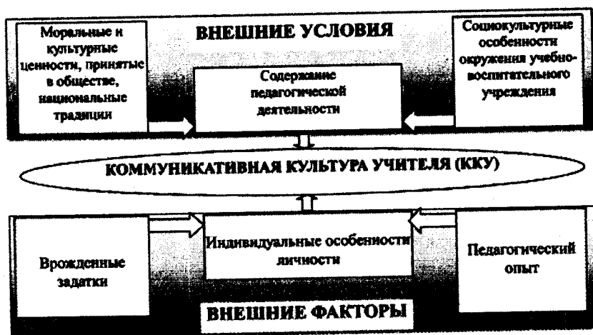
Рис.1. Коммуникативная культура учителя как социально-педагогический феномен

Важнейшей чертой коммуникативной культуры учителя является склонность к гуманистическому общению – личностному общению, позволяющему удовлетворять такие человеческие потребности, как потребность в понимании, сочувствии, сопереживании. Г.В. Бороздина подчеркивает, что гуманистическое общение детерминруется не только снаружи (целью, условиями, ситуацией, стереотипами), сколько изнутри (индивидуальностью, настроением, отношением к партнеру) «В гуманистическом общении партнер воспринимается целостно, без разделения на нужные и ненужные функции, на волевые и неволевые в данный момент качества» [8, с. 48].