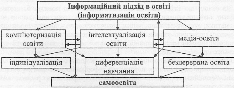
Рис. 1. Структура інформатизації освіти