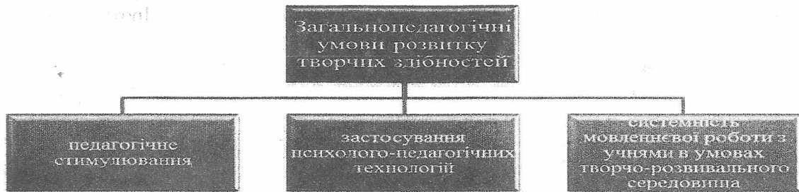
Рис. 1.2. Психолого-педагогічні умови розвитку творчої особистості школярів

На думку Д. Романовської, психолого-педагогічними умовами розвитку творчої особистості школярів у процесі мовленнєвої діяльності [2, с. 14], можна вважати такі (див. рис. 1.2.):