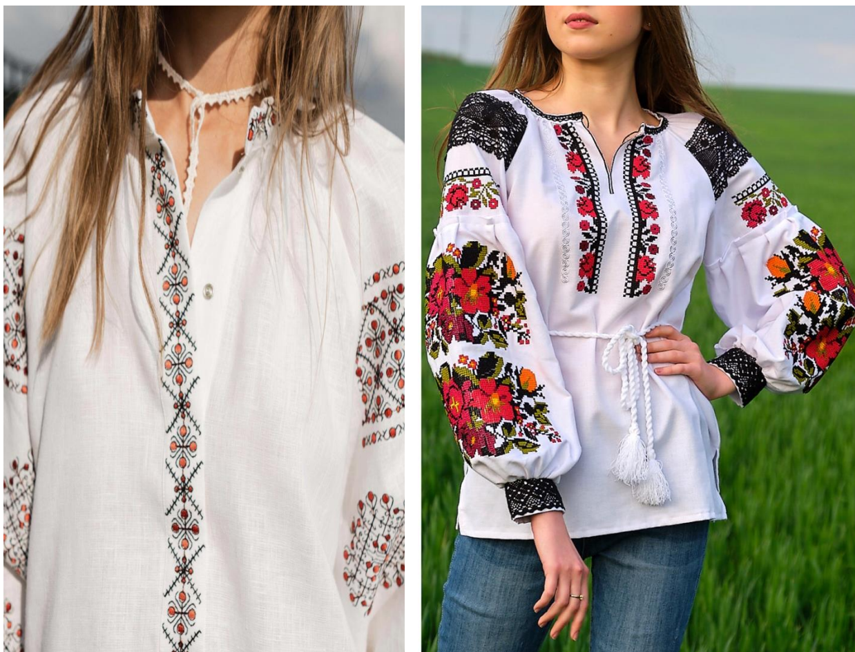
Рис.3.Оздоблення одягу вишивкою в етнічному стилі