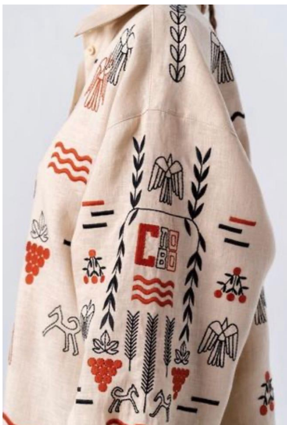
Рис.1 Лляна рубашка з етнічним оздобленням