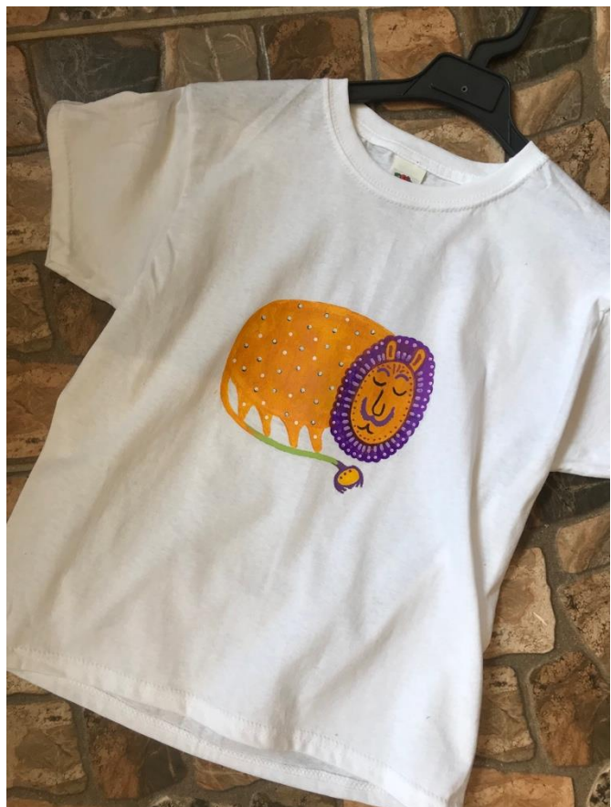
Рис.6.7 Оригінали розпису джинсів та футболки