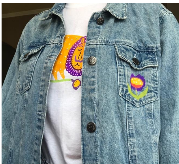
Рис.8 Розпис кармана на джинсовці