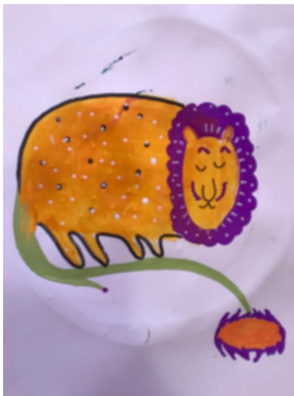
Рис.5 Композиція на футболку «Левеня»