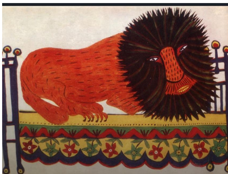
Рис.10.Марія Приймаченко «Лев» 1947р