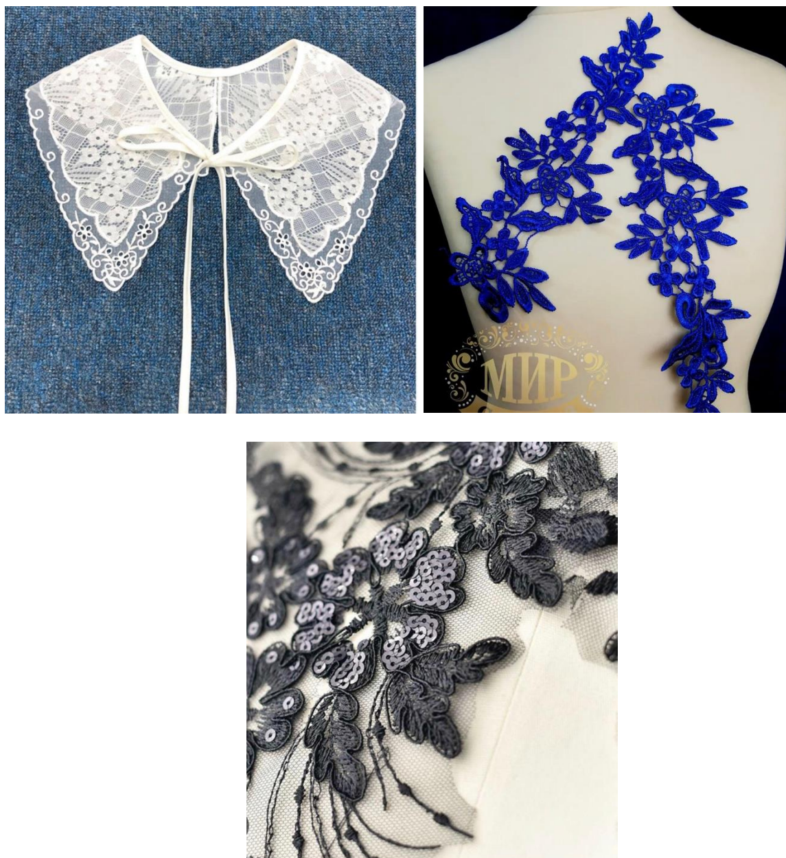
Рис.2. Мережево для декоративного оздоблення одягу