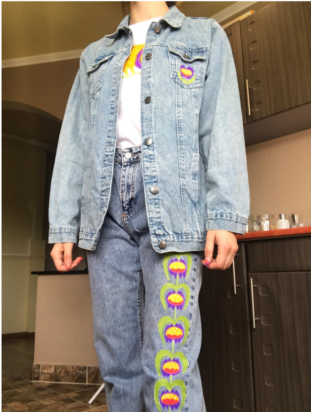
Рис.5 Загальний образ образ в оригіналі