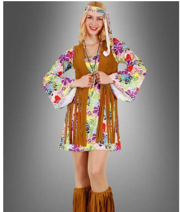
Рис.5.Оздоблення одягу у хіпі , найбільша популярність 1960-70 роках