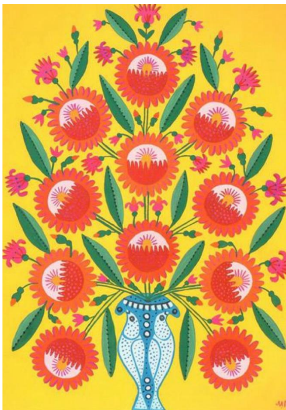
Рис.9.Марія Приймаченко «Дарую тобі, Києве, поліські квіти і ясне сонце» 1982р