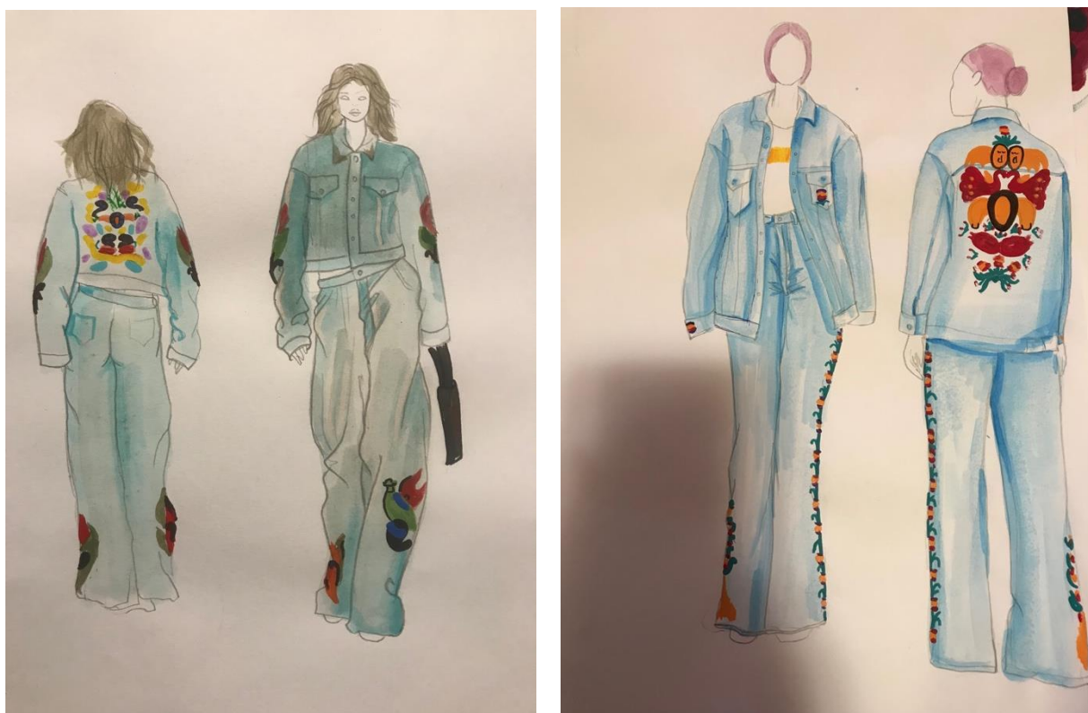
Рис.1 Пошуки варіантів оздоблення