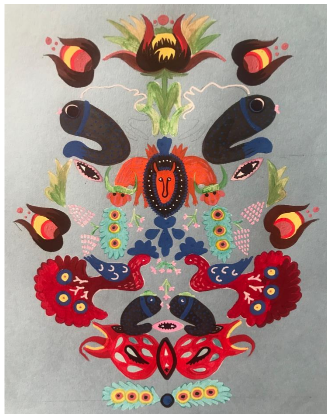
Рис.2 Пошуки композиції для розпису основного елемента одягу джинсовки