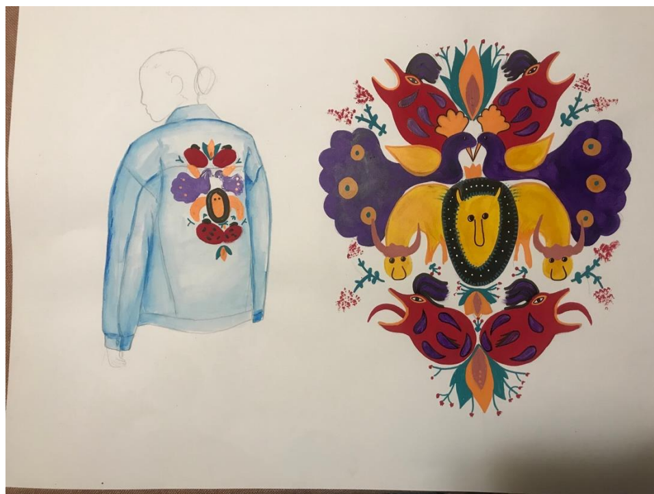
.4Рис.3 Кінцеві композиції та пошуки