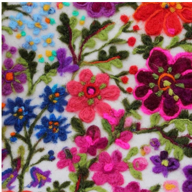
Рис.8.Оздоблення тканини квітковою вишивкою