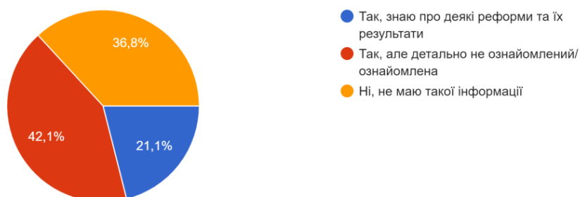
Рис 2.3. Відповіді респондентів на питання “Чи володієте Ви інформацією про євроінтеграційні реформи в Україні?”

9. Чи володієте Ви інформацією про євроінтеграційні реформи в Україні? 38 відповідей