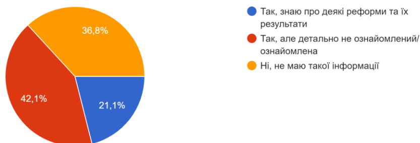
Рис 2.5. Відповіді респондентів на питання “Чи володієте Ви інформацією про євроінтеграційні реформи в Україні?”

9. Чи володієте Ви інформацією про євроінтеграційні реформи в Україні? 38 відповідей