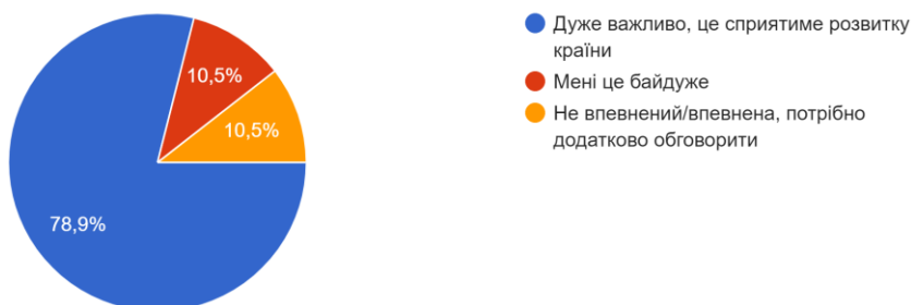
Рис 2.4. Відповіді респондентів на питання “Як Ви оцінюєте важливість євроінтеграційного процесу для майбутнього України?”

5. Як Ви оцінюєте важливість євроінтеграційного процесу для майбутнього України? 38 відповідей