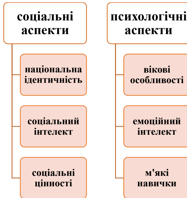
Рис. 1.1. Соціальні та психологічні аспекти сучасної молоді України [джерело складене автором]

Національну ідентичність формують у дитини ще при народженні в сім'ї. Це родинні традиції, що передаються із покоління в покоління і пов'язані саме із українським народом та його історією. Далі в дитячому садочку, школі, закладі вищої освіти – скрізь продовжується формування та розвиток національної ідентичності особистості. Усі державні освітні програми та стандарти базуються на компоненті національної ідентичності. Очевидно, що сучасна молодь, в переважній більшості, з проукраїнською позицією та орієнтована на захист і збереження власної держави. Підтвердженням цьому факту стало повномасштабне вторгнення в Україну в лютому 2022 року. Адже саме молодь стала рушійною силою воєнного опору, волонтерського руху, соціальної допомоги тощо. Отже, сучасна молодь має свою національну ідентичність, що є тією рисою, яка визначає українця посеред інших національностей.