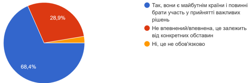
Рис 2.6. Відповіді респондентів на питання “Чи вважаєте Ви, що молодь має активно брати участь у процесі євроінтеграції?”

11. Чи вважаєте Ви, що молодь має активно брати участь у процесі євроінтеграції? 38 відповідей