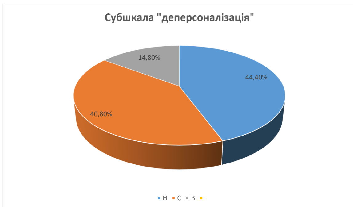
Рис. 2.2. Рівневий розподіл учителів за субшкалою «деперсоналізація»

Примітка: Н – низький рівень; С – середній рівень; В – високий рівень «Редукція особистих досягнень» на високому рівні проявилась у 11,1% респондентів. У таких вчителів усталеною є мотивація на зниження рівня домагань, знецінення власних здобутків і, як можливий наслідок, колег (учнів). Переважає песимізм, негативізм, заперечувальна позиція, пасивність тощо. Такі психологічні і професійні характеристики властиві учителям з середнім і низьким рівнями «редукції», але з менш вираженими негативними ознаками (рис. 2.3).