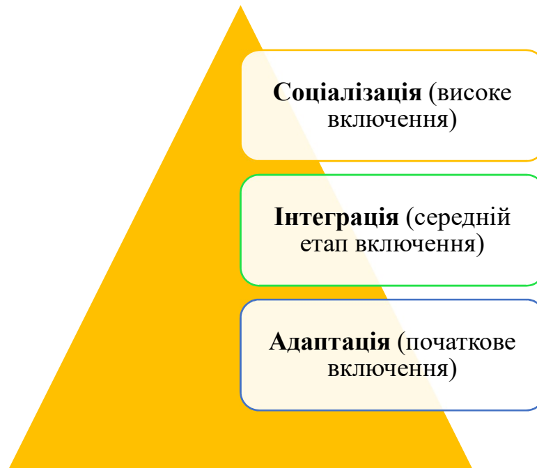
Рис. 1.3. Ієрархічна структура понять адаптація, інтеграція та соціалізація здобувачів вищої освіти

університету, а також про певну ієрархічну структуру зазначених понять, а саме (Рис. 1.3):