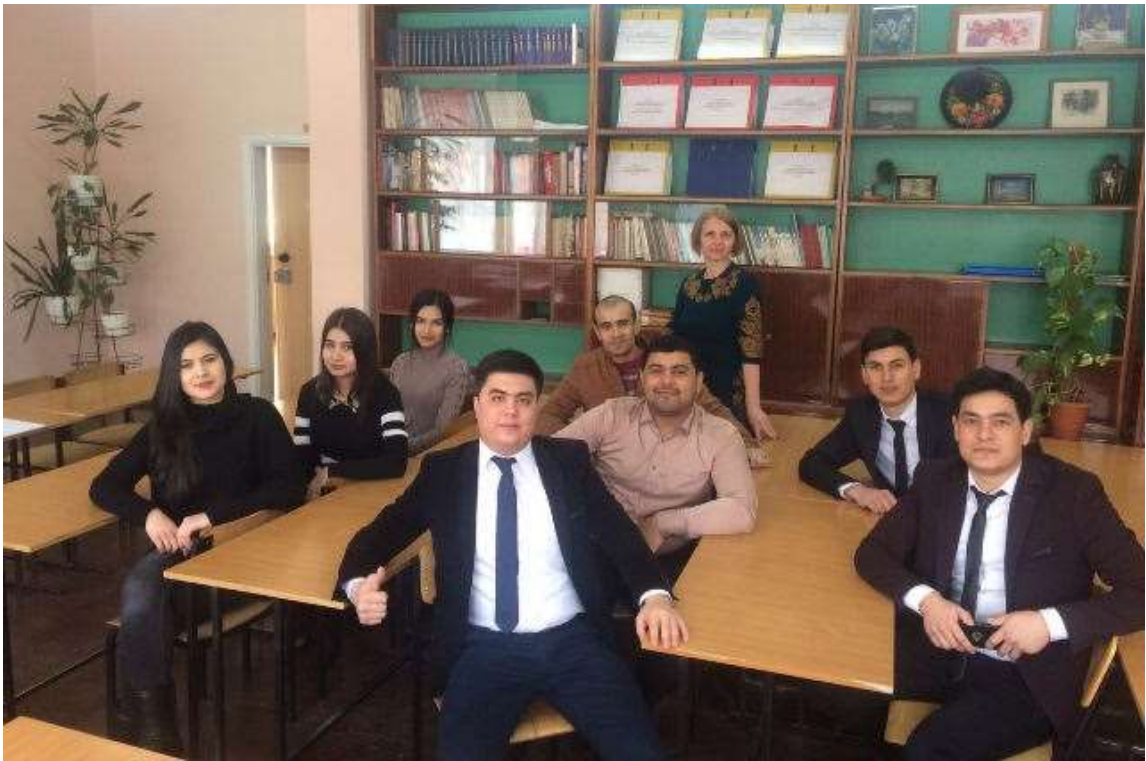
Рис. 2.4. Проведення кураторської години зі студентами-іноземцями