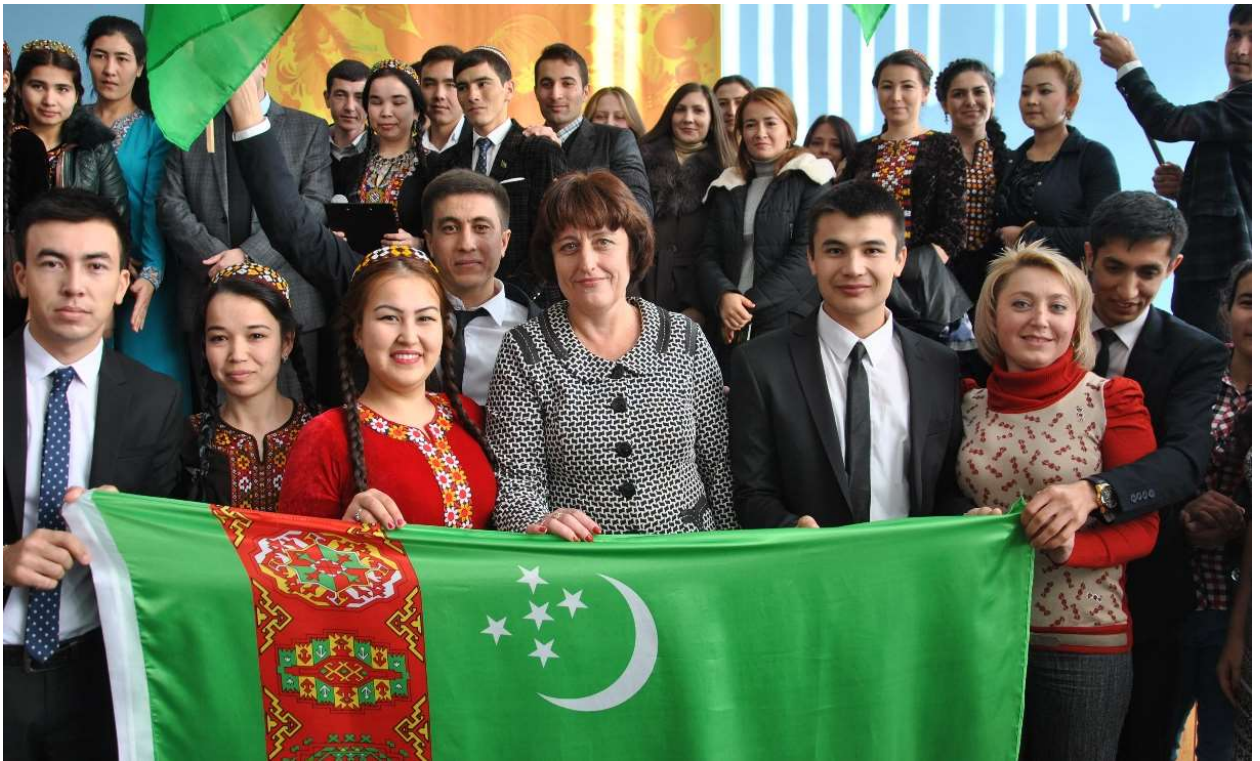
Рис. 2.2. Відзначення Дня Туркменістану у Криворізькому державному педагогічному університеті