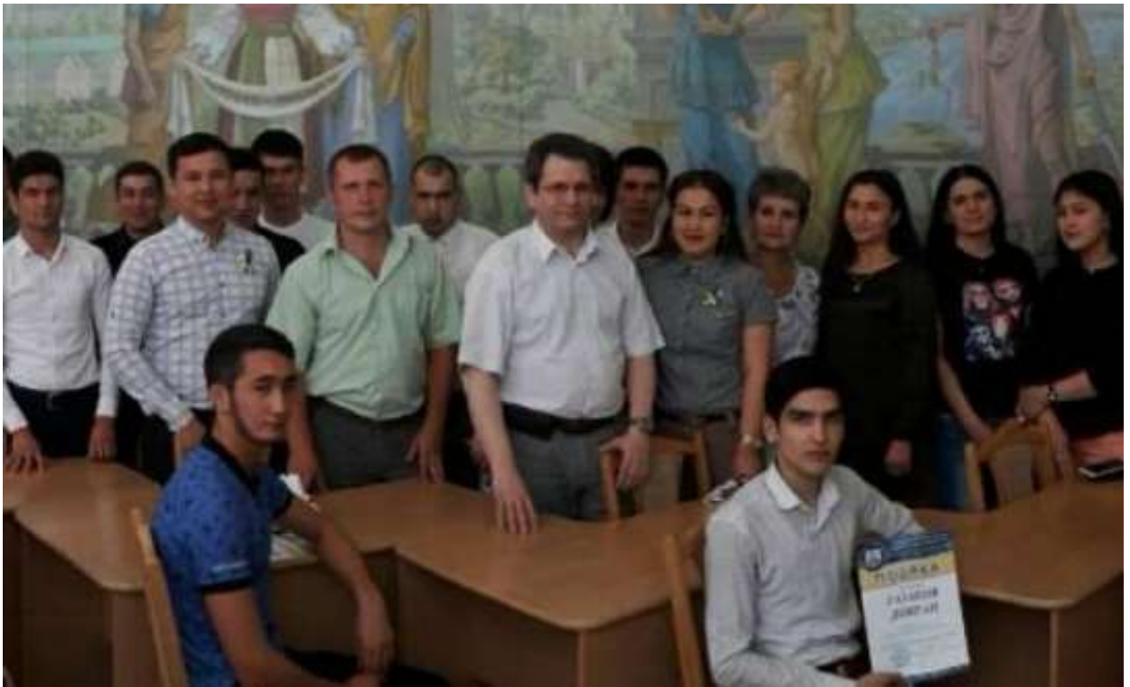
Рис. 2.3. Вручення подяк університету кращим студентам-іноземцям у Криворізькому державному педагогічному університеті