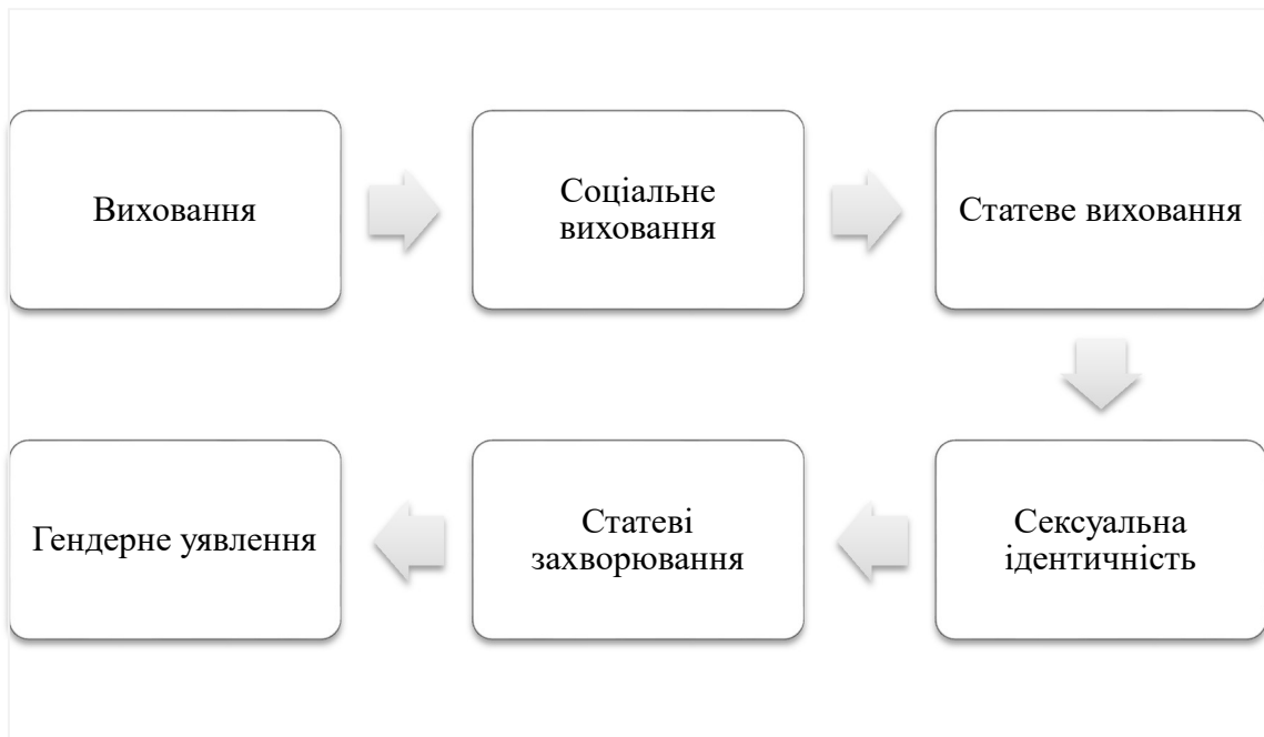
Рис. 1.1. Терміносистема соціостатевого виховання