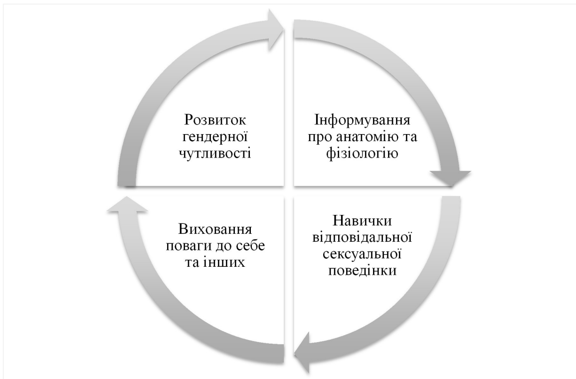
Рис. 1.2. Циклічна структура соціостатевого виховання