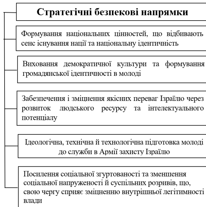
Рис.1. Стратегічні безпекові напрями, що реалізуються у системі вищої освіти Ізраїля

Позиція держави полягає у тому, що університетські дослідження розглядають як такі, що забезпечують безпеку Ізраїлю не лише у військовій галузі, але й інших секторах економіки. На рис. 1 наведено основні стратегічні напрями, що сприяють забезпеченню безпеки Ізраїлю.