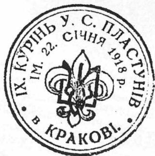
Печатка Куріню пластунів