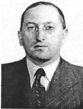
Професор Фердинанд Цвейг