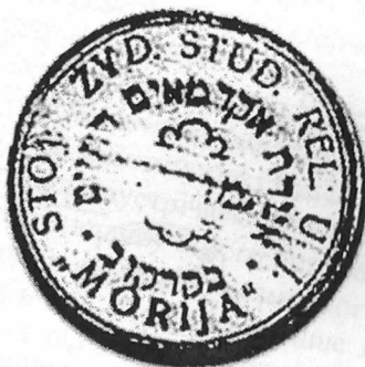
Печатка товариства Морія