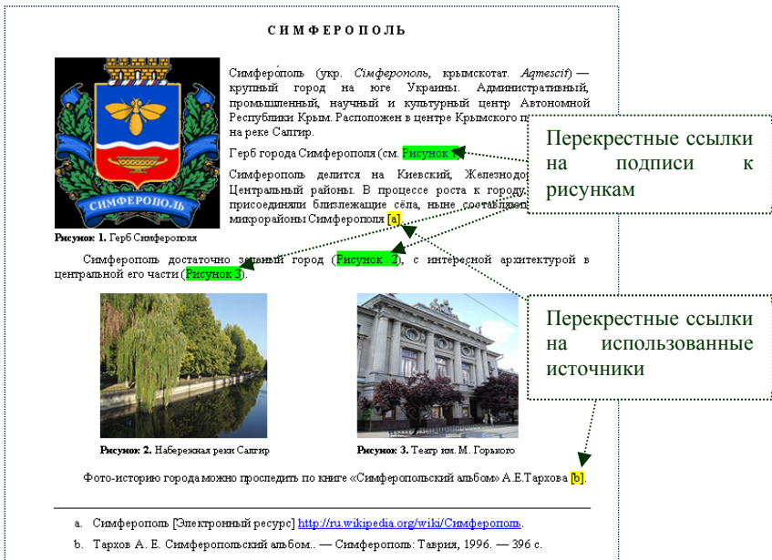
Рис. 2. Образец выполнения задания № 2

Источники литературы в конце документа нумеруются автоматически (формат списка).