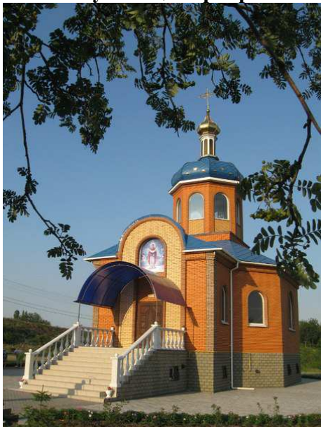
Додаток А. Інгулецька церква Святої Великомучениці Варвари