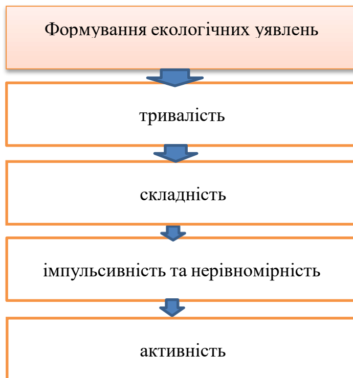
Рисунок 2.1 Поетапність формування екологічних уявлень

З огляду на сутність екологічного виховання дошкільників, слід також звернути увагу на специфіці цього процесу, а саме (рис. 2.1):