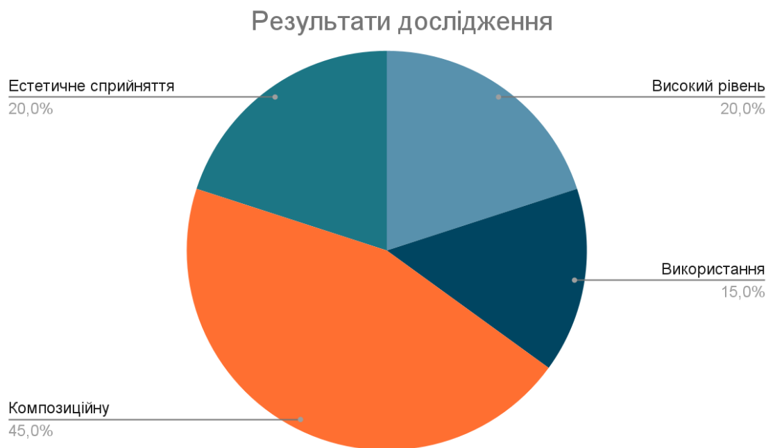
Рис. 3.2. Результати дослідження впливу на розвиток творчих здібностей учнів шляхом вивчення народної вишивки

Висновок дослідження підтверджує, що вивчення народної вишивки має позитивний вплив на розвиток творчих здібностей учнів. Участь у курсі з вишивки дозволяє учням розкрити свою творчість, розвинути естетичне сприйняття, експериментувати з кольорами та композицією, а також вдосконалити навички точного виконання швів. Результати дослідження можуть послужити підставою для рекомендацій щодо включення вивчення народної вишивки у навчальну програму з метою стимулювання творчого розвитку учнів.