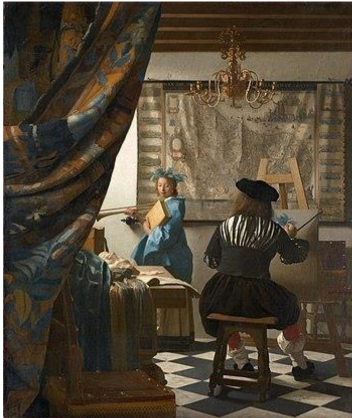
Рис. 5. Ян Вермер «Алегорія живопису» 1666