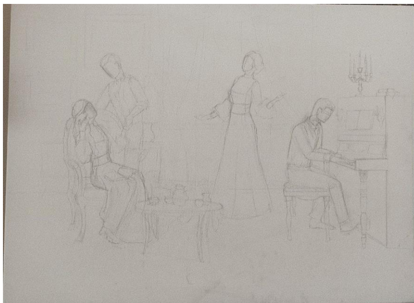
Рис. 11 Лінійний малюнок на полотні