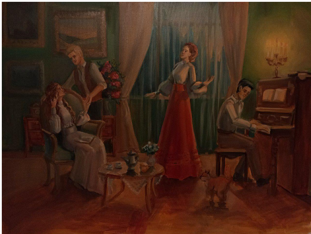
Рис. 14. Робота над деталями