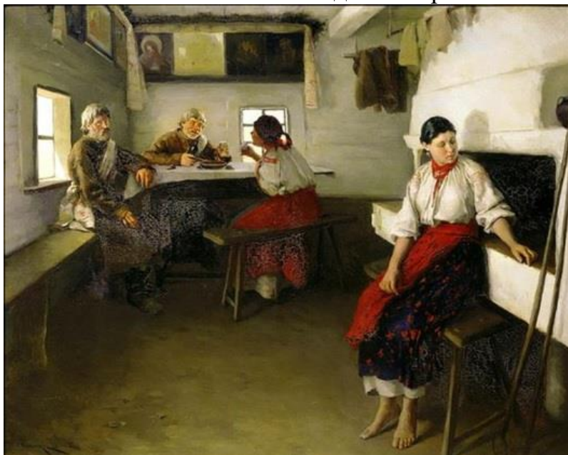
Рис. 3. Микола Пимоненко «Свати» 1882.