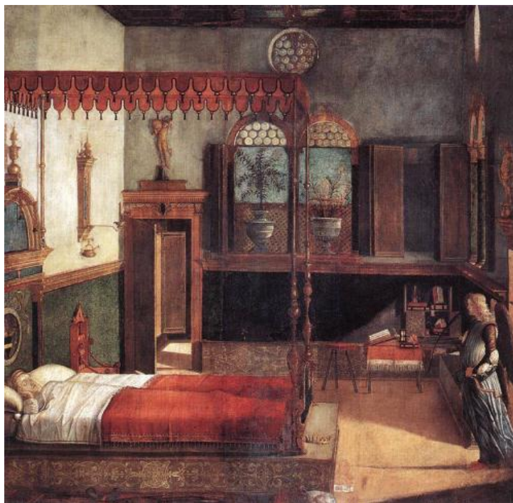
Рис. 7. Витторе Карпаччо «Сон св. Урсули»