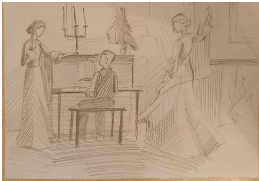
Рис. 2. Пошукові начерки і замальовки