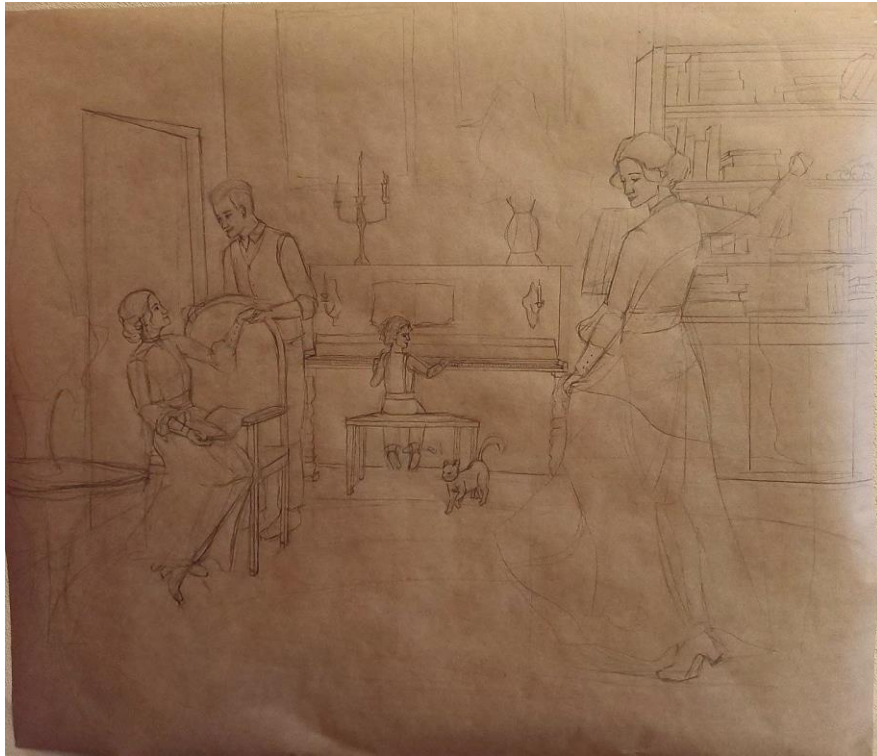
Рис. 5. Картон до кваліфікаційної роботи