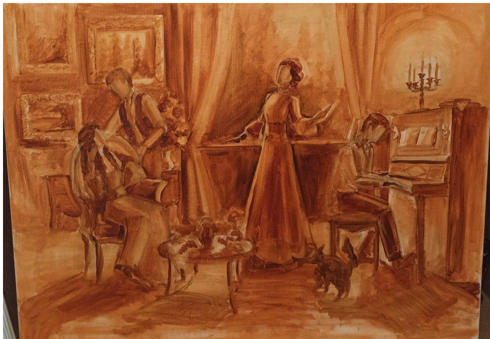
Рис. 12. Підмалювок