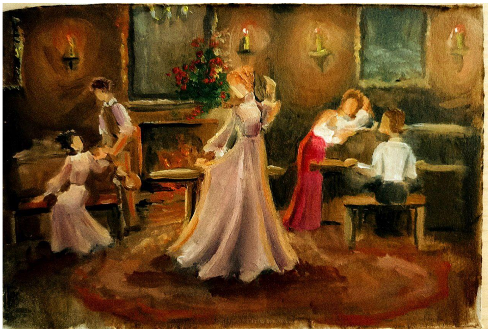
Рис. 9. Пошуковий етюд до кваліфікаційної роботи