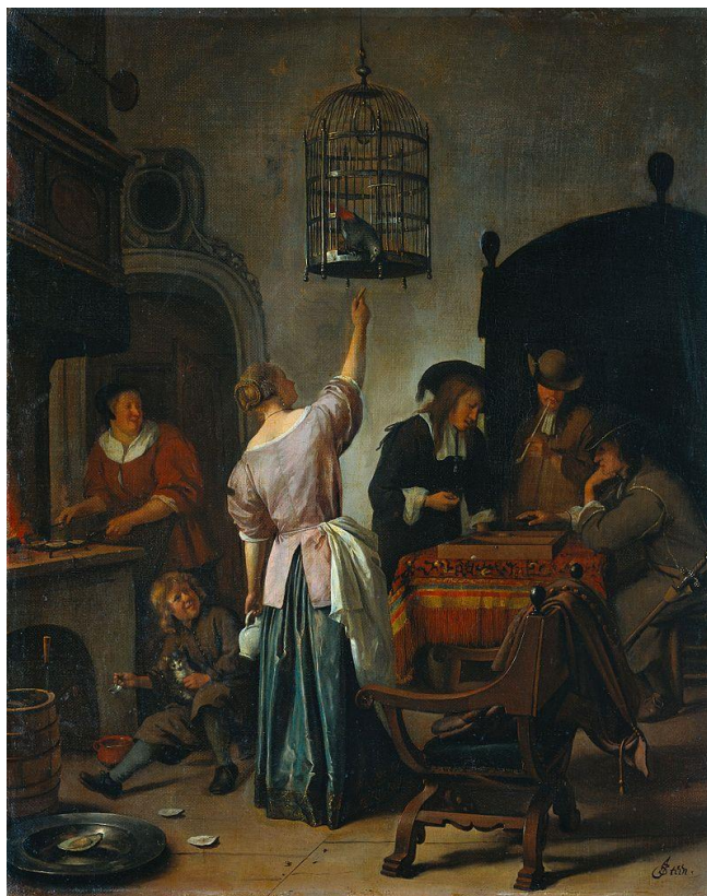
Рис..9. Ян Стейн «Клітка з папугою»1667