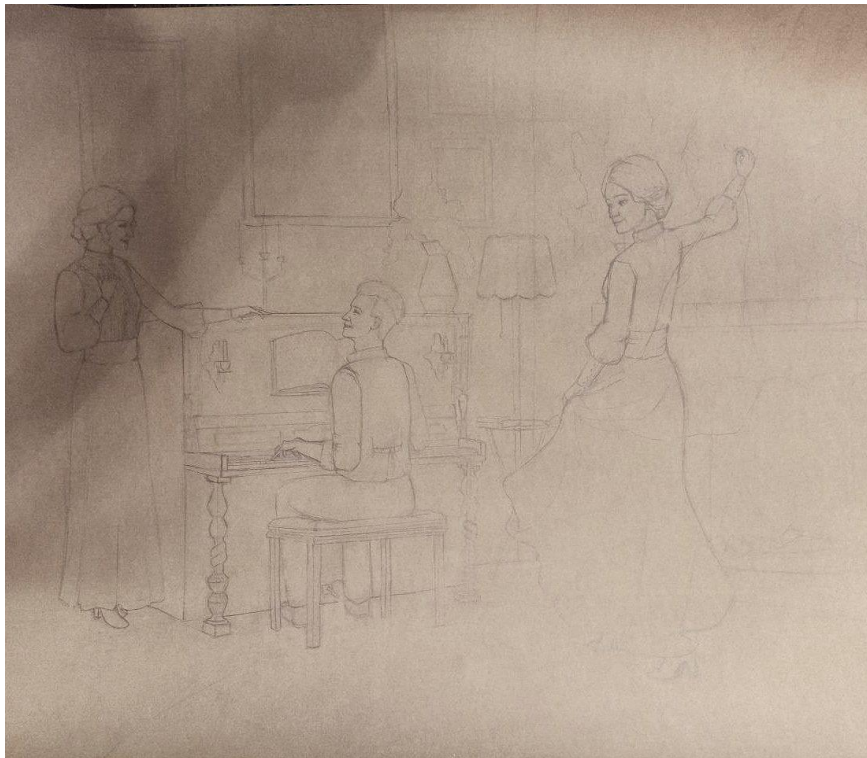
Рис. 4. Картон до кваліфікаційної роботи