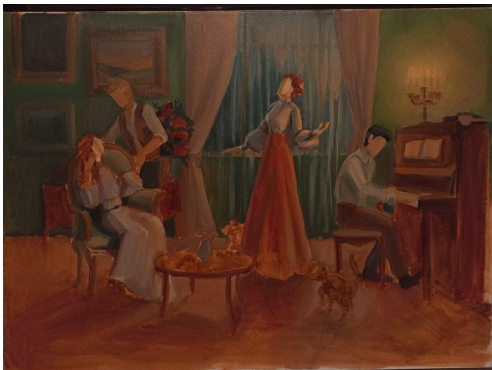
Рис. 13. Етап роботи