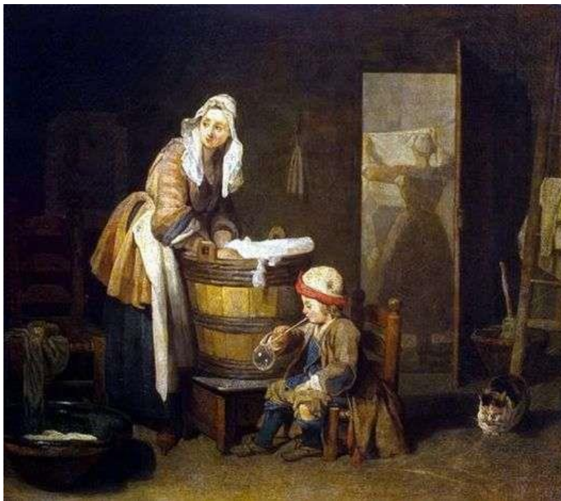
Рис. 4. Жан-Батист Шарден «Прачка» 1733.