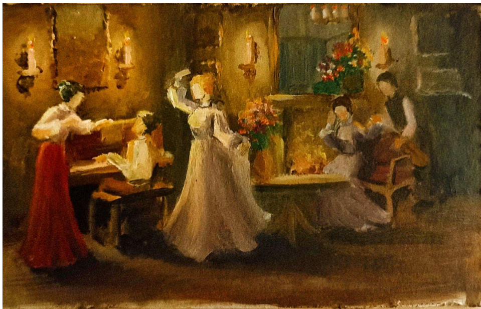
Рис. 8. Пошуковий етюд до кваліфікаційної роботи