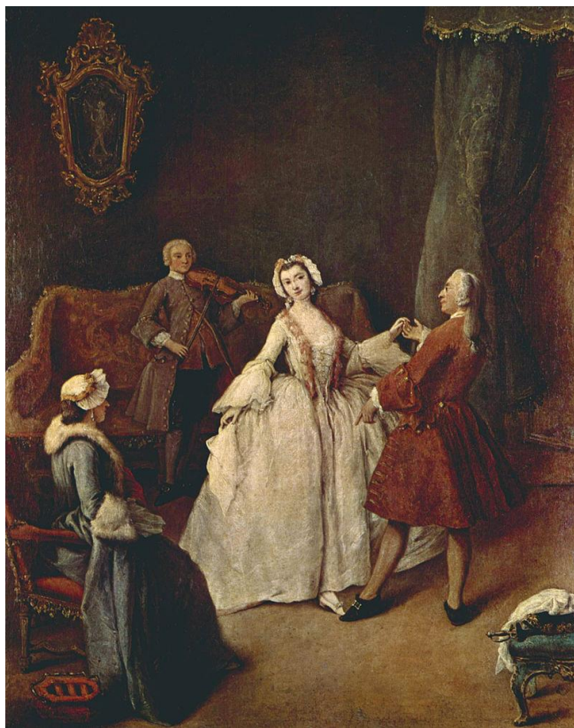
Рис. 1. П'єтро Лонгі «Урок танцю», Венеція 1740—1750.