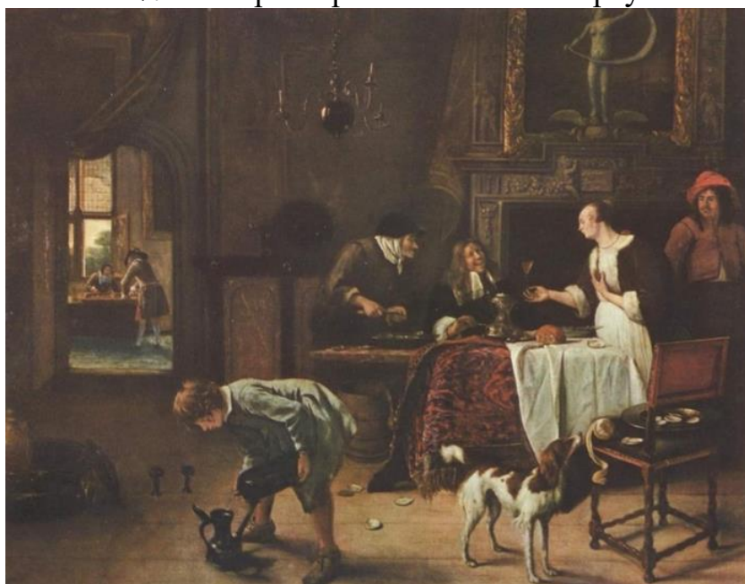
Рис. 8. Ян Стейн «Таке протягом життя» 1661