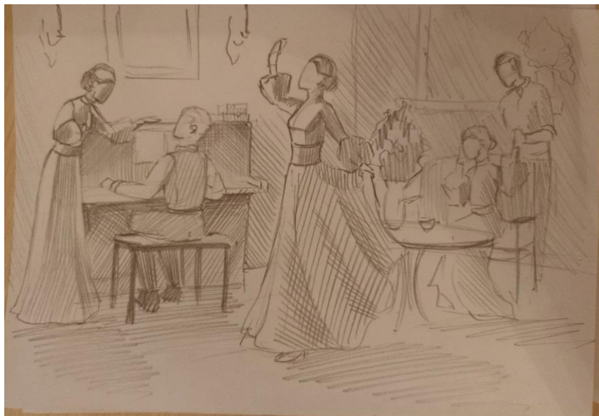
Рис. 1. Пошукові начерки і замальовки