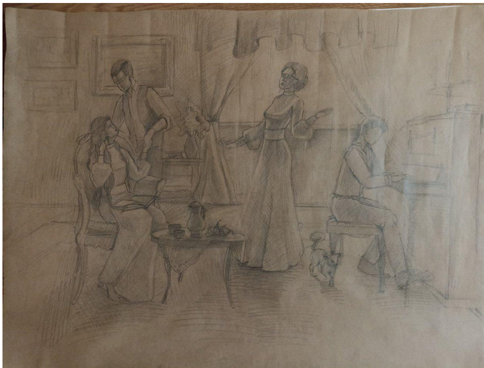
Рис. 7. Картон у тоні до кваліфікаційної роботи