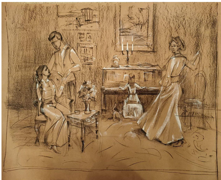
Рис. 6. Картон у тоні до кваліфікаційної роботи