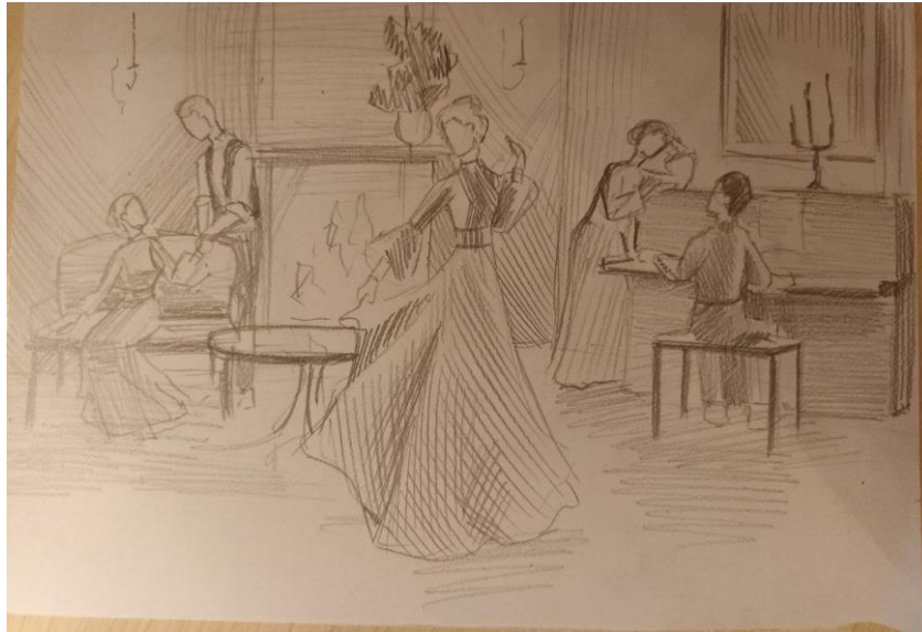
Рис. 3. Пошукові начерки і замальовки