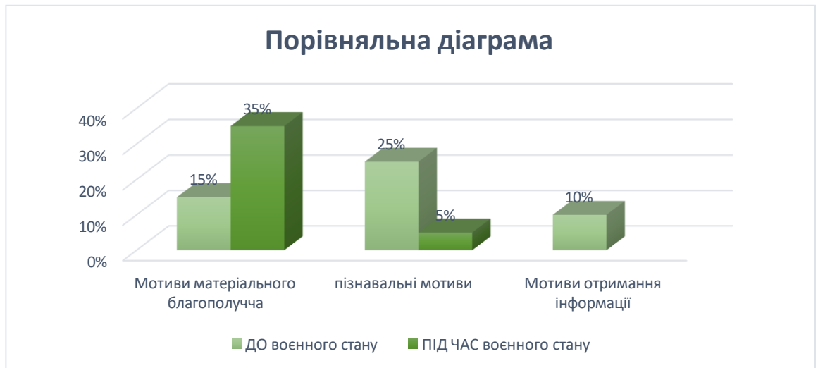
Рис.2.2. - Порівняльна діаграма мотивів навчальної діяльності дівчат Враховуючи, що у хлопців до та в період воєнного стану мотиви до навчання дуже відрізняються, то для зручності ми зробимо діаграму, яка буде ілюструвати динаміку мотивів(рис. 2.3).