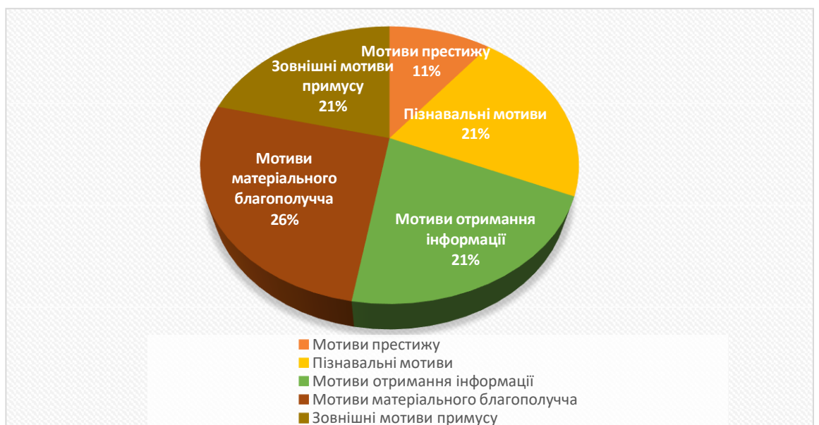
Рис.2.3. - Показники мотивів хлопців обох груп

Рис.2.2. - Порівняльна діаграма мотивів навчальної діяльності дівчат Враховуючи, що у хлопців до та в період воєнного стану мотиви до навчання дуже відрізняються, то для зручності ми зробимо діаграму, яка буде ілюструвати динаміку мотивів(рис. 2.3).