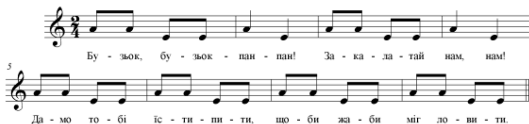
Рис.2.5. Вправа на вдосконалення музичного слуху

Мімічні вправи також опрацьовуються за допомогою методу порівняльного аналізу.