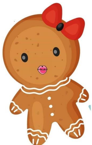
Рис. Д. 3. Вправа «Посмішка до вушок»

в) «Кишені». Вуста замкнуті, язичок, штовхаємо в праву щічку, потім в ліву. Повторюємо вправу 5-7 разів (рис. Д. 4., Д. 5).