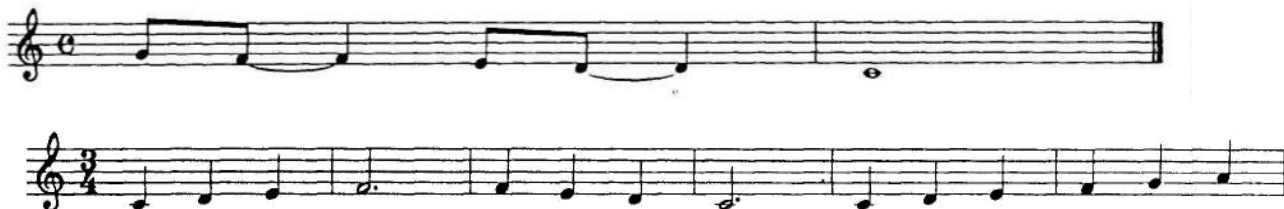
Рис. 2.9. Вправа на відпрацювання штрихів

– Мі-і-і-і-йа-а-а, (мі-і-і-і на стакато, йа-а-а спів легато, і навпаки мі-і-і-і на легато, йа-а-а спів стакато) (рис. 2.9.).