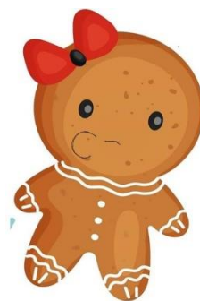
Рис. Д. 4., Д. 5. Вправа «Кишені»