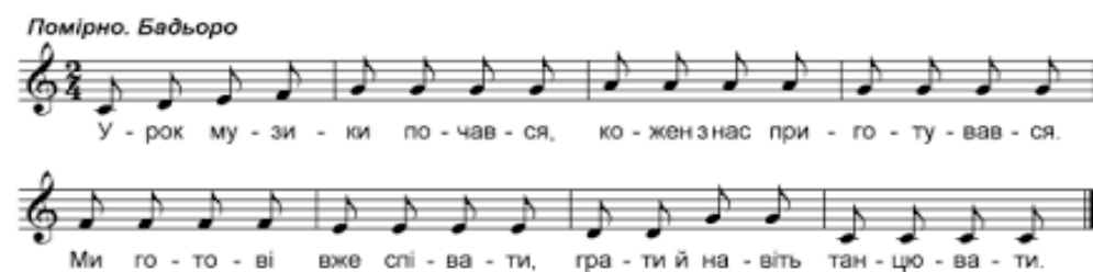
Рис.2.1. Музичне привітання

Вітаю вас, мої любі діти! Щиро рада бачити вас у нашому вокальному класі, де ви продовжуєте відкривати для себе багато цікавих і нових здібностей. Давайте зараз ми з вами привітаємось, але тепер ми це зробимо музично (рис. 21.).