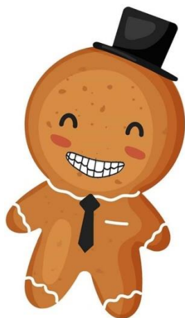
Рис. Д. 2. Вправа «Посмішка до вушок»

б) «Посмішка до вушок». Дуже широко посміхаємось, а потім згортаємо вуста у маленьку трубочку. Повторюємо вправу 5-6 разів (рис. Д. 2., Д. 3.).