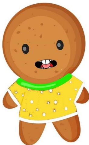
Рис. Д. 1. Вправа «Неслухняний язичок»

а) «Неслухняний язичок». Язик покласти на нижню губу та промовляти «пя-пя-пя», неначе похлопувати свій «неслухняний язичок» верхньою губою (рис. Д.1.).