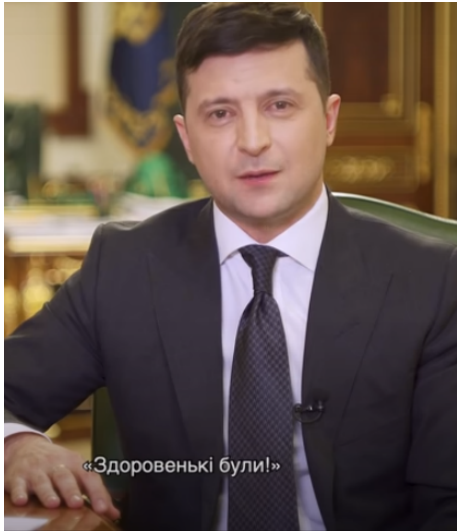
Рисунок 2. Дружній емоційний “сигнал” Президента під час вітання

людей за допомогою емоційних слів та поєднує їх із контрольованими емоційними “сигналами” на обличчі, доречність застосування яких дає змогу просувати власні політичні переваги. Такий дружній емоційний “сигнал” ми бачимо під час вітання (рис. 2).