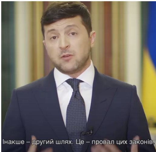
Рисунок 3 Емоційний “сигнал” про невдоволення роботою депутатів Верховної Ради

електроенергію для населення за борги. Говорить про доставку ліків і їжі незахищеним верствам населення; дає завдання НБУ, Мінфіну та Мінекономіки розрахувати програму кредитних канікул для бізнесу та виплатити допомогу людям, які були скорочені через карантин. Він акцентує, що розуміє потреби всіх регіонів і разом із Кабінетом Міністрів України робить усе, щоб їх забезпечити.