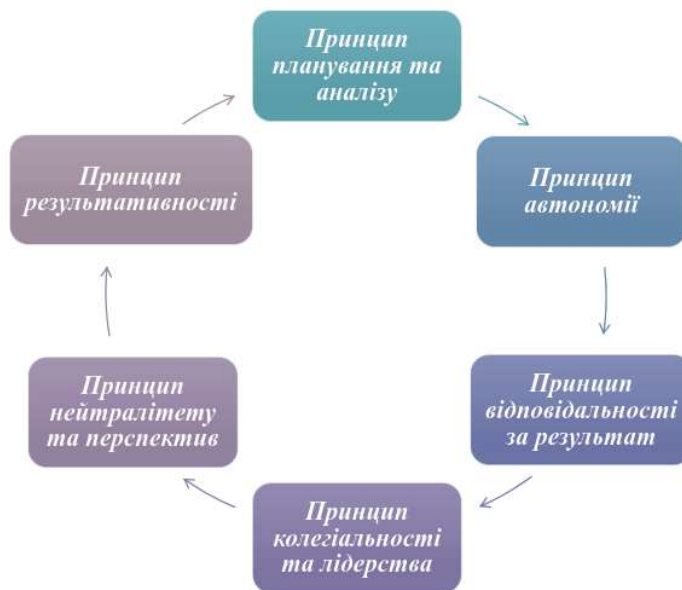
Рисунок 2. Основні принципи роботи з дітьми в системі освіти.

Приклад оформлення діаграми в презентації із зазначенням джерела.