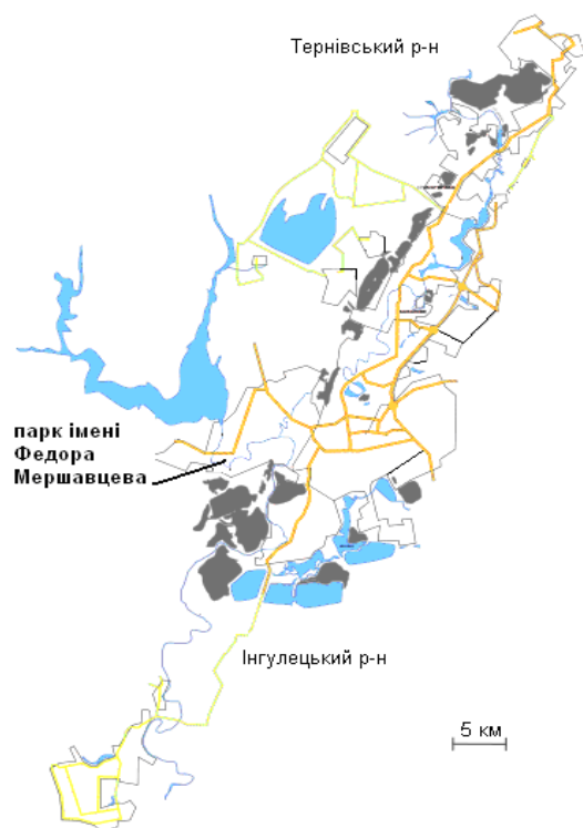
Рис. 1. Місцезнаходження парку ім. Федора Мершавцева на мапі м. Кривий Ріг