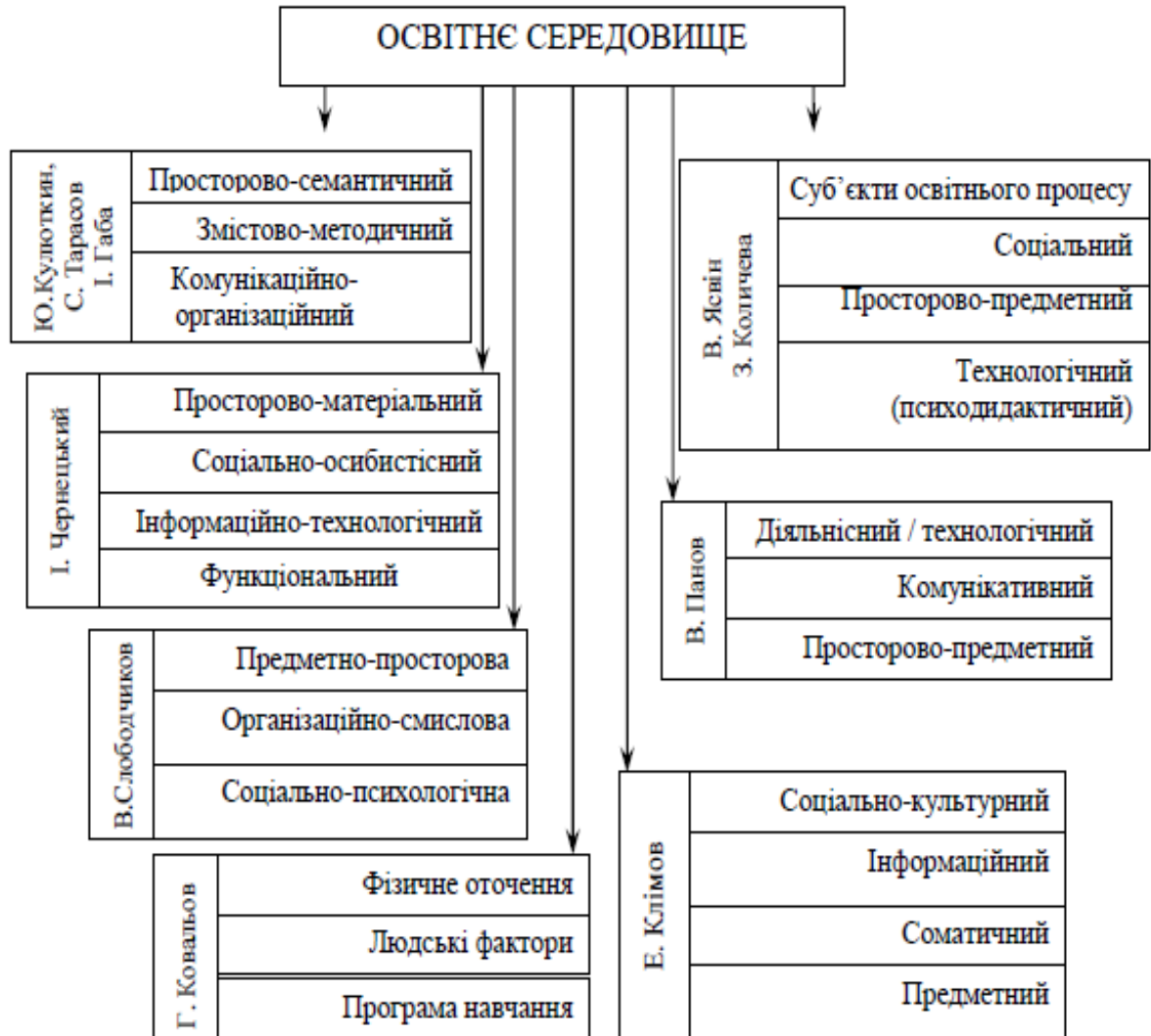
Рис. 1. Структурні компоненти освітнього середовища: сучасні наукові підходи.

При певній семантичній схожості виокремлених компонентів очевидно, що структуру ОС складають такі чинники: