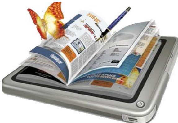
Рис. 2. Візуалізація 3D-книги

Під час роботи з книгою її можна обертати в тривимірному просторі; наближувати об'єкти для розгляду або віддаляти їх. Крім того, можна створювати тематичні 3D-книжки. Сьогодні майбутні педагоги вже можуть опанувати різні програми, орієнтованими на створення 3D-книжок, зокрема, Flipbook Maker, iSpring Suite або ZooBurst. Наприклад, ZooBurst – цифровий інструмент, який має потужні функціональні можливості віртуальної організації 3D-світу змістового наповнення книги. Студент може створювати персонажів книги власноруч, завантажувати з додаткових ресурсів або скористатися вбудованою базою даних ZooBurst, яка нараховує більше 10 000 ілюстрацій, картинок, матеріалів тощо (рис. 3).