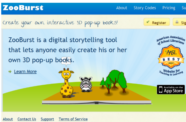
Рис. 3. Програма створення 3D-книг ZooBurst

Під час роботи з книгою її можна обертати в тривимірному просторі; наближувати об'єкти для розгляду або віддаляти їх. Крім того, можна створювати тематичні 3D-книжки. Сьогодні майбутні педагоги вже можуть опанувати різні програми, орієнтованими на створення 3D-книжок, зокрема, Flipbook Maker, iSpring Suite або ZooBurst. Наприклад, ZooBurst – цифровий інструмент, який має потужні функціональні можливості віртуальної організації 3D-світу змістового наповнення книги. Студент може створювати персонажів книги власноруч, завантажувати з додаткових ресурсів або скористатися вбудованою базою даних ZooBurst, яка нараховує більше 10 000 ілюстрацій, картинок, матеріалів тощо (рис. 3).