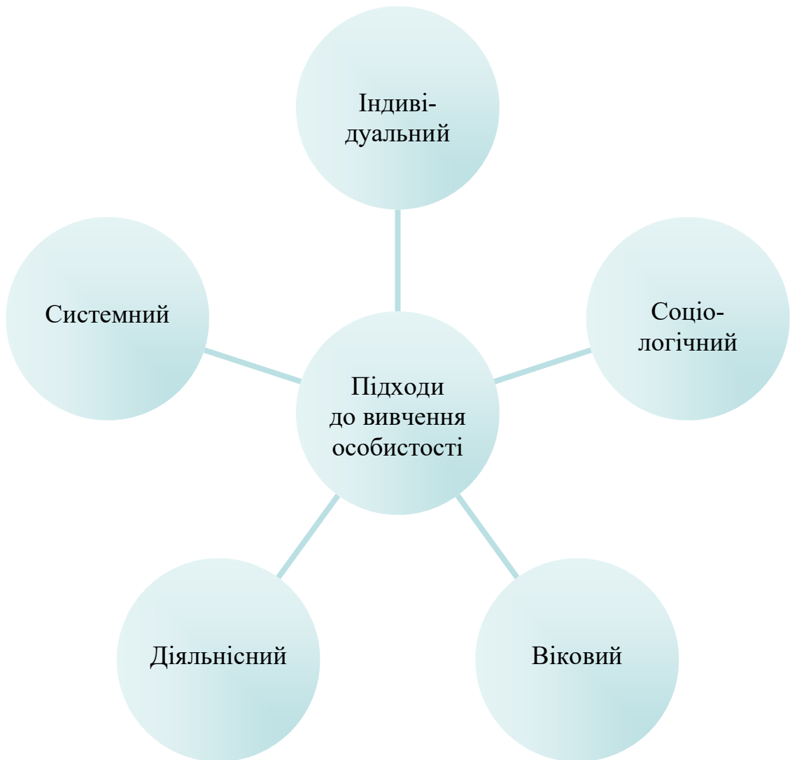
Рис. 1 Психолого-педагогічні підходи до вивчення особистості (за В. В. Рибалко)

соціальної ситуації розпитку та прояву особистості, якщо розглядати цю ситуацію у всьому її діапазоні — від сім'ї та найближчих референтних груп до виробничих колективів, соціальних інститутів й людської цивілізації в цілому (Л. І. Божович, Л. С. Виготський, І. С. Кон, Г. С. Костюк).