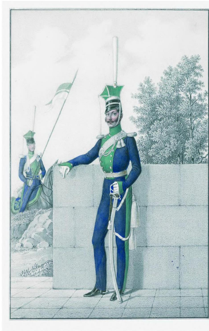
РЯДОВЫЙ ОВЕРЬ-ОФИЦЕРЪ 4 го Бугскаго Уланскаго полка, 1817 и 1818.