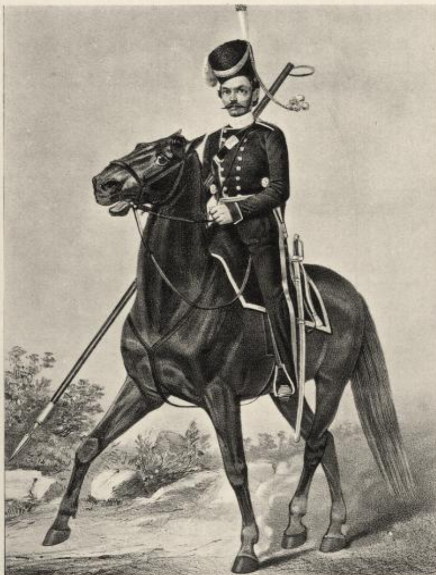
УРЯДНИКЪ Бугскаго Казачьяго Войска, 1812-1817.