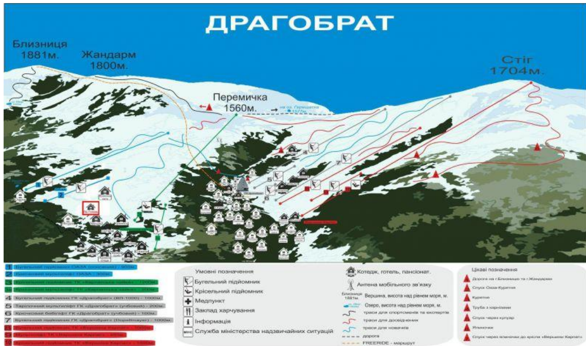
Рис. 2.1. Схема гірськолижного курорту «Драгобрат».