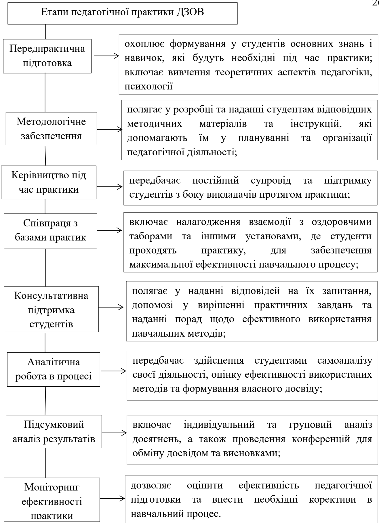
Рис.1.2. Етапи проведення практики за Ю. Підборським [29].