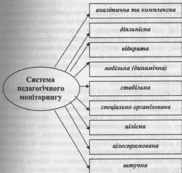
Схема 1. Характеристики системи педагогічного моніторингу

Процес та обробка інформації про стан процесу навчання є однією з головних завдань моніторингу, а, значить, інформаційний характер взаємодії усіх суб'єктів процесу навчання є одним з найважливіших системоутворюючих факторів.