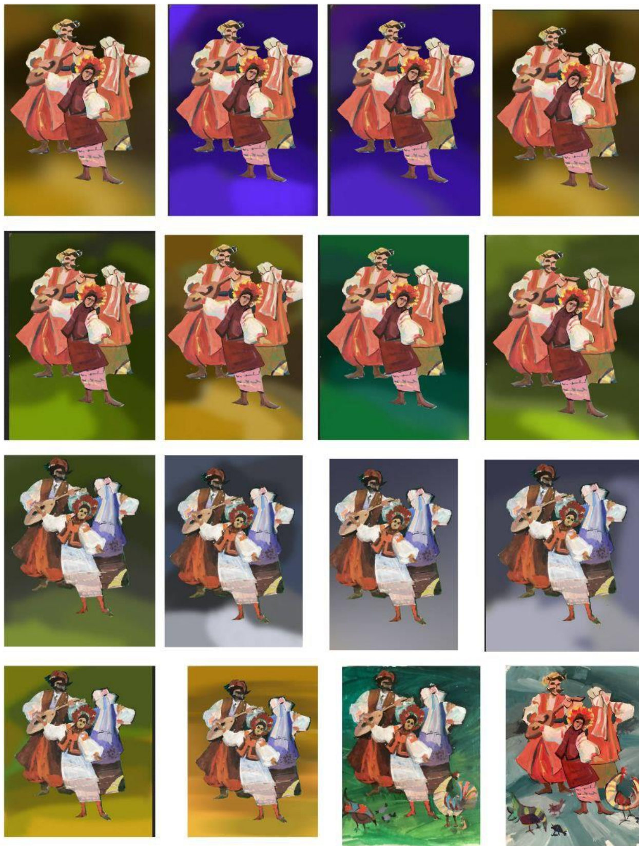
Рис. 19-35. Кольорові пошуки