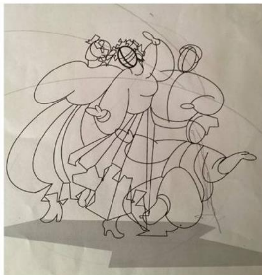
Рис.1-4. Пошуки мотиву та композиційного вирішення