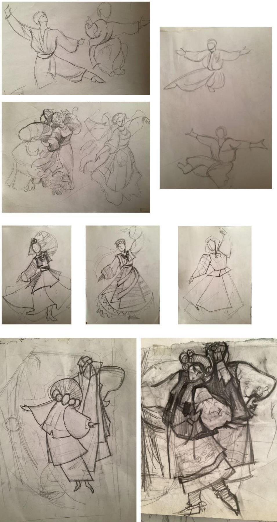
Рис. 5-12. Пошуки образу