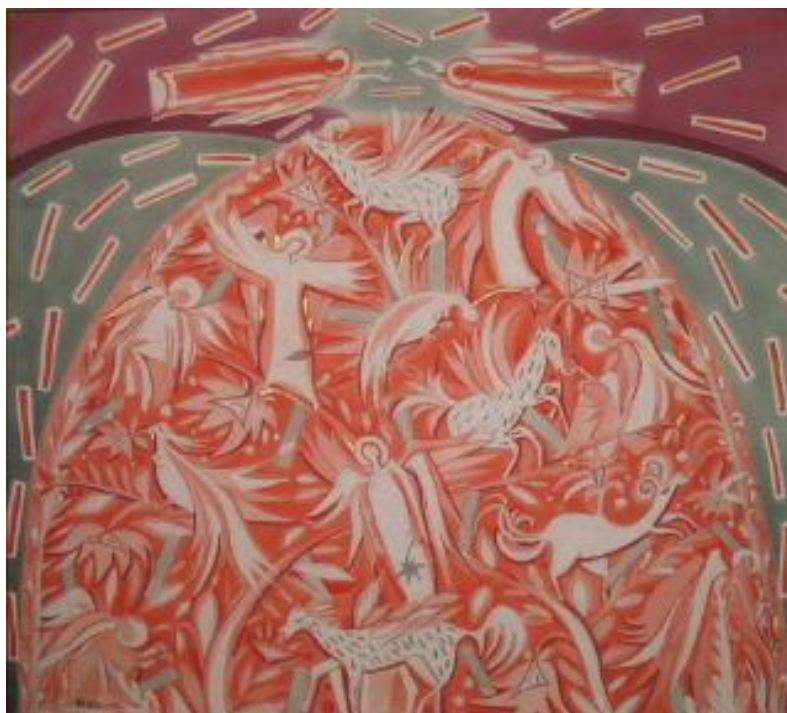
Рис.4. Гронська Н. Натхнення. Пам'яті Марії Примаченко. Із серії «Віщі сни», 2009 р.