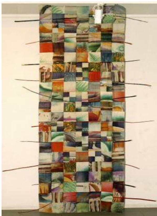
Рис.6. Гронська Н. «Календар», 2004 р.