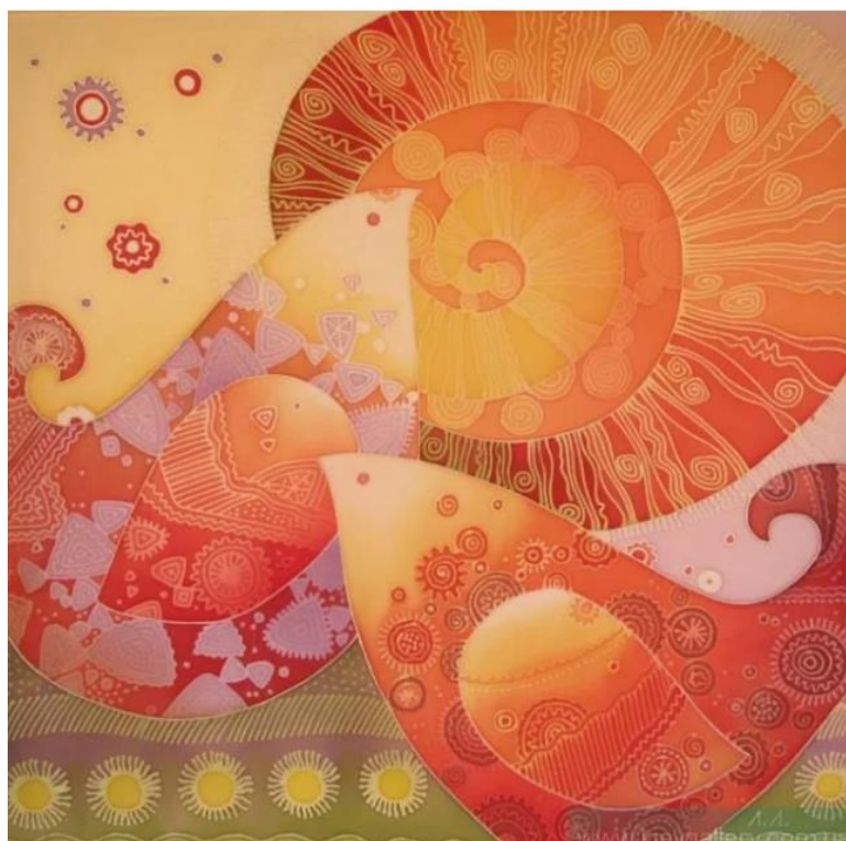
Рис.2. Лукаш Л. «Весна червона», 2012р.