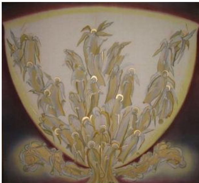
Рис.5. Гронська Н. Світло в темряві. Із серії «Віщі сни», 2009 р.