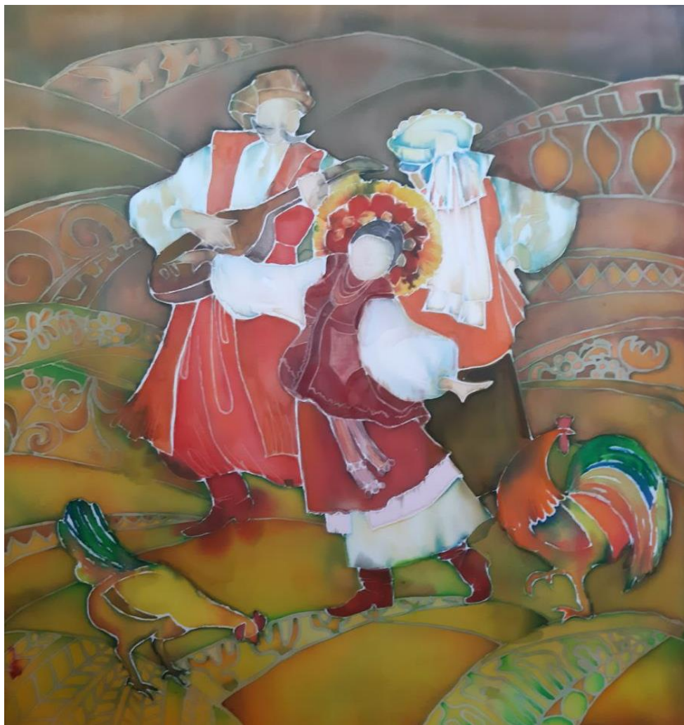
Рис. 36. Виконання фрескізу в матеріалі