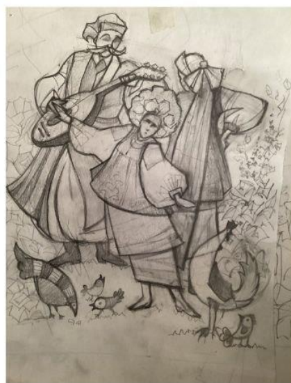
Рис.13-17. Тонові пошуки