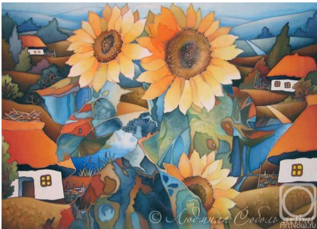
Рис.1. Соболев Л. «Квітуча Україна», 2009 р.