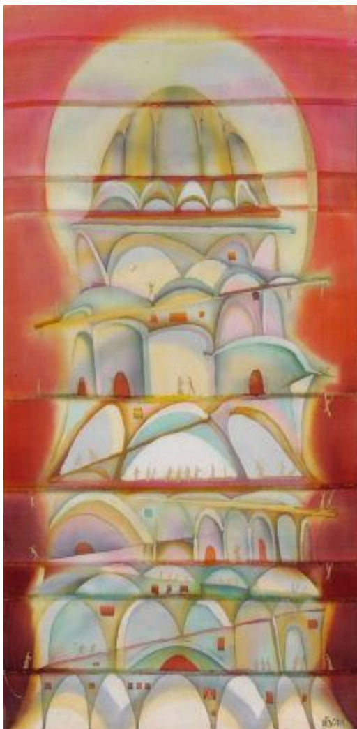
Рис.7. Гронська Н. «Вавилонська вежа».