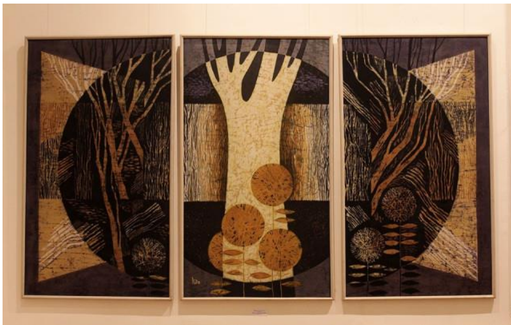
Рис.3. Литвин О. триптих «Чорний ліс», 1988 рік