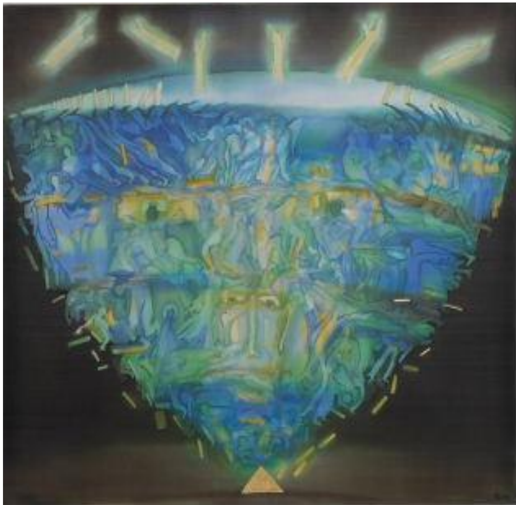
Рис.9. Гронська Н. «Те, інше». Із серії «Віщі сні», 2009 р.