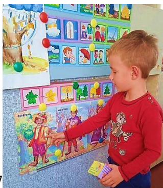
помилки. Мал.. 7

Процедура виконання: Дитині пропонують скласти оповідання, використовуючи 5 запропонованих слів (наприклад: осінь, листя, ліс, білочка, діти). Після розповіді дитині пропонують оцінити власну розповідь, сказати, чи всі слова вона використала, чи не припустилася помилок. Після чого дитині пропонується прослухати запис свого оповідання і виправити