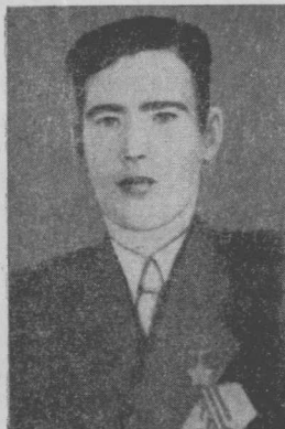
І. М. Шевченко