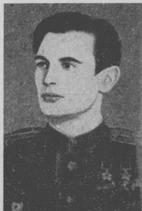
Двічі Герой Радянського Союзу В. І. Михлик