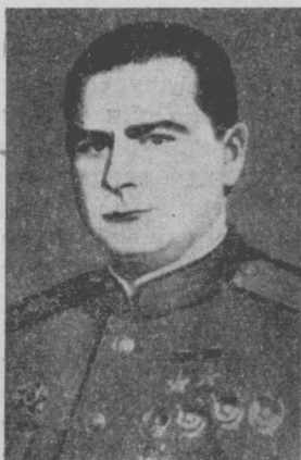
Двічі Герой Радянського Союзу Д. Б. Глінка