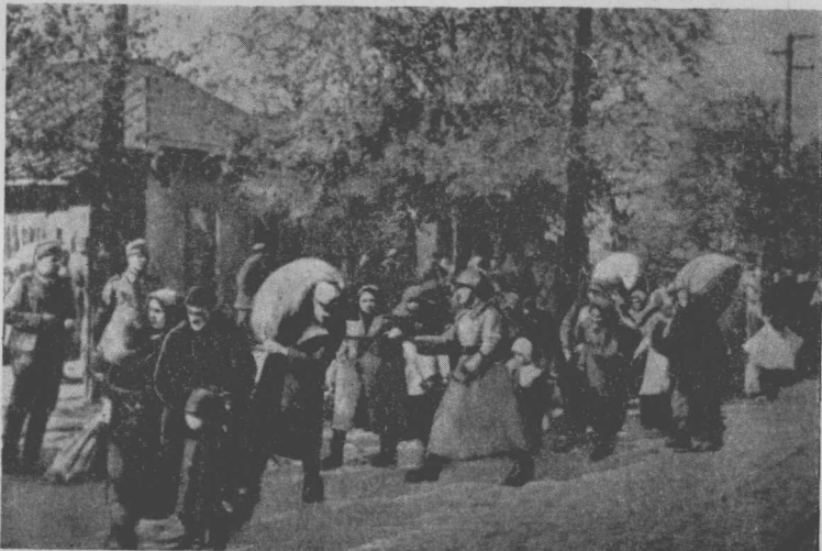
Гітлерівці виганяють населення Кривого Рога в фашистське рабство.