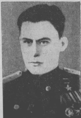
А. І. Труд