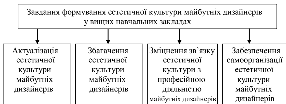
Рис. 2. Завдання формування естетичної культури майбутніх дизайнерів у вищих навчальних закладах

Нами досліджено це питання і на цій основі визначено основні завдання формування естетичної культури майбутніх дизайнерів у вищих навчальних закладах (рис. 2).