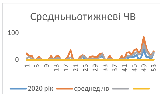
Рис. 2. Тижневі значення ЧВ

знизу, майже періодичність змін СА. 1908р. Хейл Д.Е. встановив магнітну природу плям на Сонці та закон змін полярності. Це свідчить про 22-літній період СА. Її міряють числами Вольфа (ЧВ) W=k(10g+f) . Але середньомісячні ЧВ скривають наявність коротких «місячних» коливань з періодом 28 діб, 4 тижня (рис. 2). Таких в році 13 циклів. 2020 рік – рік мінімуму СА; тільки в кінці його СА була достатньо значною. 208 діб ЧВ=0 (57%) були без плям. ЧВ мають найменше не нульове значення 11 (1 група з 1 плямою), у 2019 таких днів 281 (77%), 2018 (61%). Вони утворили 3-річчя мінімуму СА, після яких буде 2 р. підйому, а потім 3 максимуму, за якими 3 роки спаду. Вони утворюють 11-річний цикл. СА.