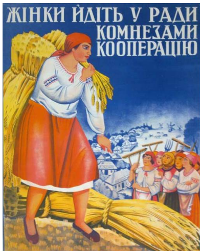
«Жінки, йдуть у ради, комнезами, кооперацію» (І. Падалка, 1926 р.)