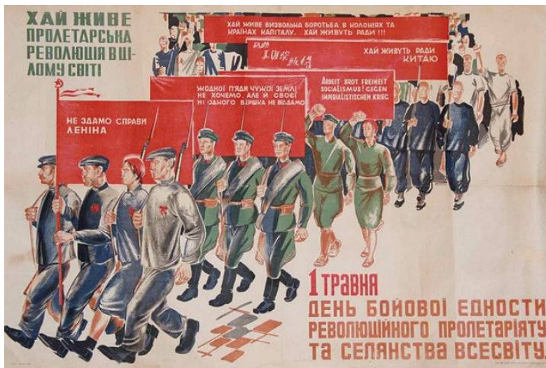
Плакат УСРР (орієнтовно 1931–1932 рр.)

та фізичною працею, створити «однотипову соціалістичну структуру радянських націй та народностей» 982 .