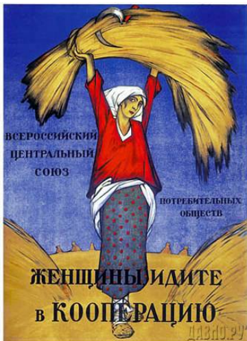
«Жінки, ідіть в кооперацію» (І. Нівінський, 1918 р.)