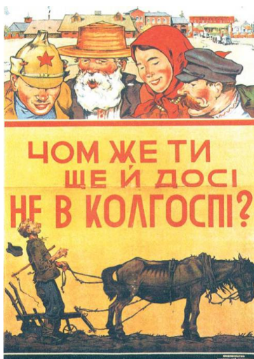
«Чом же ти ще й досі не у колгоспі» (1929 р.) «Селянко, йди в колхоз!» (О. Дейнека, 1930 р.)