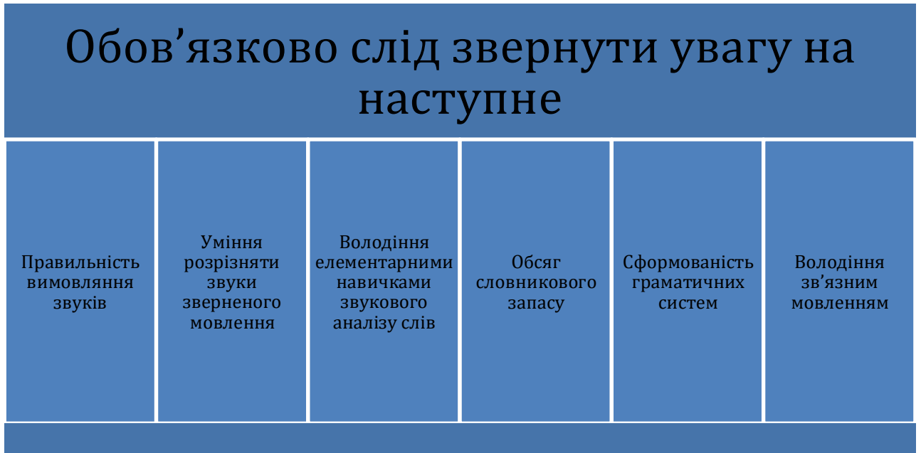
Рис. 2.1. Важливі аспекти мовленнєвого розвитку

Розглянемо дидактичний матеріал для дослідження всіх названих сторін мовлення, для усунення порушень а також, наведено необхідні пояснення щодо його практичного застосування.