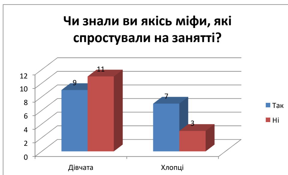
Рис. 3.6. Результати відповідей здобувачів освіти на питання: «Чи знали ви якісь міфи, які спростували на занятті?»

Із таблиці 3.6 ми бачимо, серед дівчат було 9 осіб, які знали міфи, які спростували після тренінгу, а серед хлопців таких було аж 11 осіб. Ну і не знали міфи 7 дівчат та 3 хлопця.