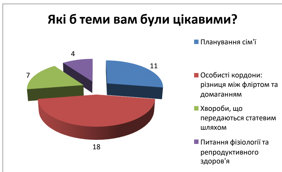
Рис. 3.8. Відповіді на питання: «Які теми вам були б цікавими?»

Із таблиці 3.8 ми бачимо, що здобувачі освіти 11-го класу цікавлять наступні теми: 11 осіб цікавить питання планування сім'ї; 18 здобувачів освіти цікавить питання про особисті кордони: різниця між домаганням та фліртом; 7 здобувачів освіти цікавить питання про хвороби, що передаються статевим шляхом; 4 здобувачів освіти цікавить питання фізіології та репродуктивного здоров'я.