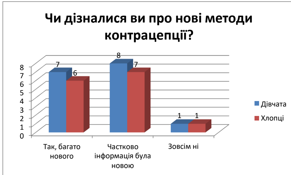
Рис. 3.3. Результати відповідей на питання: «Чи дізналися ви про нові методи контрацепції?»

Із таблиці 3.3 ми бачимо, що багато нового для себе взнали 7 дівчат та 6 хлопців; частково інформація була новою для 8 дівчат та 7 хлопців; і інформація зовсім не була новою для 1 хлопця і 1 дівчини.