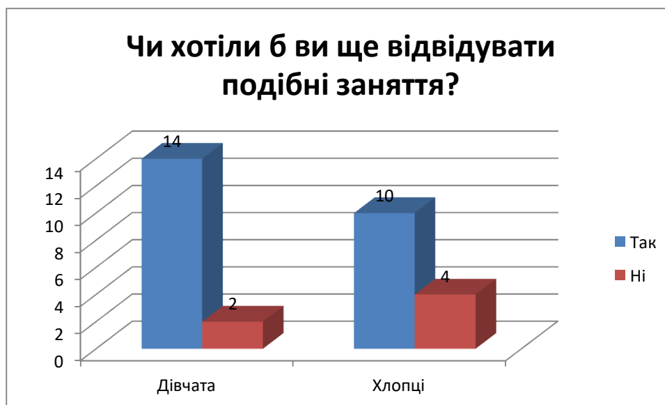
Рис. 3.7. Результати відповідей здобувачів освіти на питання: «Чи хотіли б ви ще відвідувати подібні заняття?»

Із таблиці 3.7. ми бачимо, що подібні заняття ще хотіли б відвідувати 14 дівчат та 10 хлопців; не хотіли б більше відвідувати подібні заняття 2 дівчат та 4 хлопців.