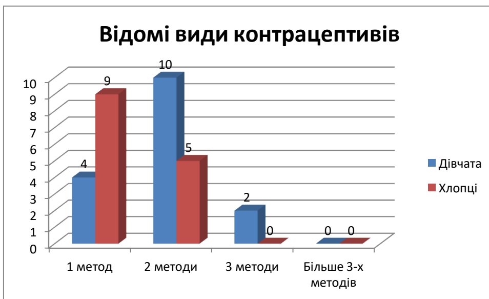
Рис. 3.2. Результати відповідей на питання: «Види контрацептивів відомі здобувачам освіти»

На рисунку 3.2 ми наочно відобразимо результати представлені у таблиці 3.2.