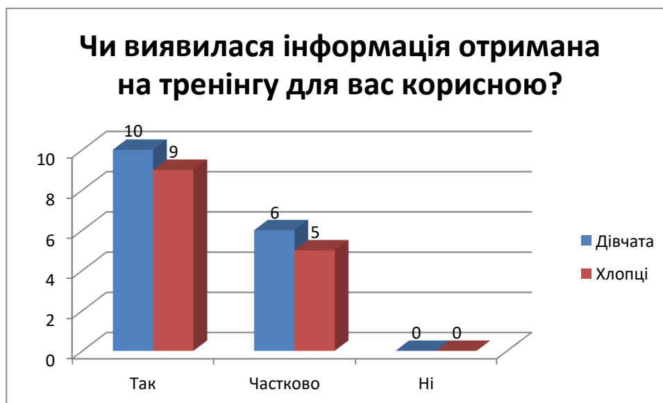
Рис. 3.4. Результати відповідей здобувачів освіти на питання: «Чи виявилася інформація, отримана на тренінгу для вас корисною?»

здобувач освіти не заявив про те, що для нього ця інформація корисною не була.