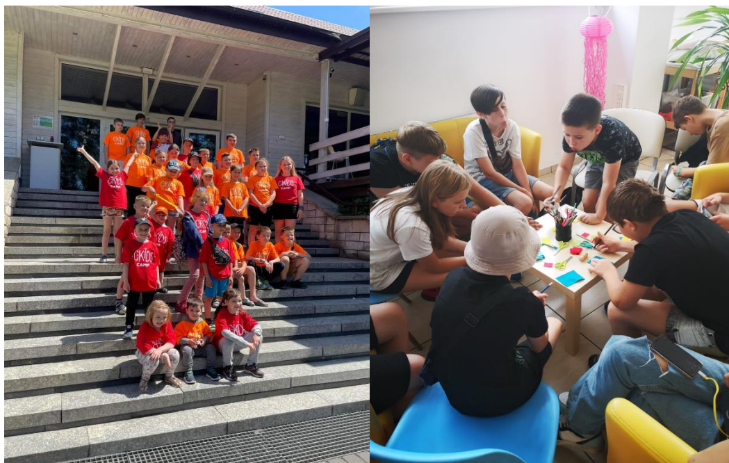
Рис.2.2. Фото проєкту “Допомога нашим українським друзям - 2022”

Взимку 2023 року українські діти, які приїхали до м.Глівіце, Польщі у зв'язку з військовими подіями, стали учасниками тижневого табору. У проєкті "Від мистецтва до серця - у пошуках простору для діалогу через музику, кіно і театр" брали психолог, українські та польські вчителі. В кінці тижня було проведено анкетування батьків (Додаток В). Всі батьки відзначили багато позитивних аспектів від участі дітей у даному проєкті: