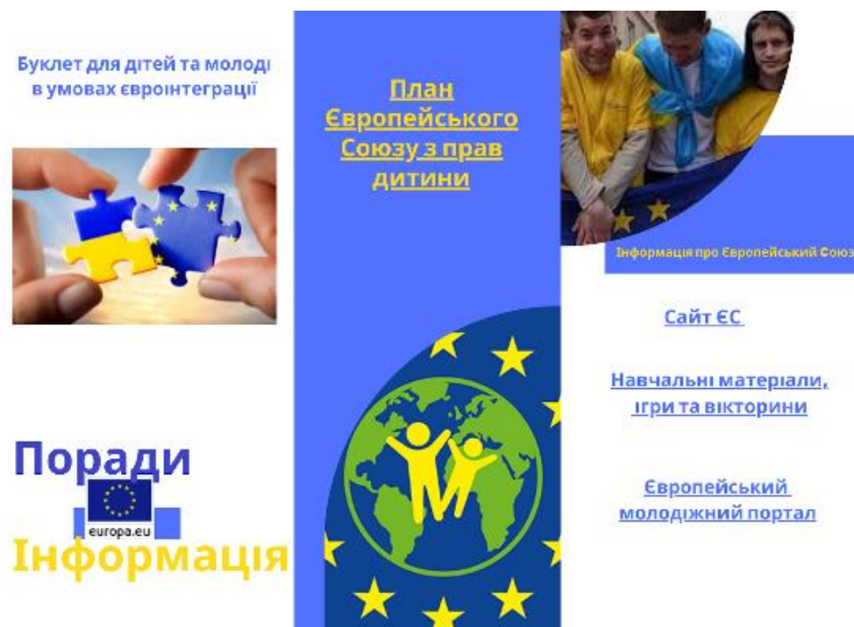
Рис. 3.1 Буклет “Поради та інформація”

Пропонуємо власно створений буклет для дітей та молоді щодо питань євроінтеграції за посиланням Буклет