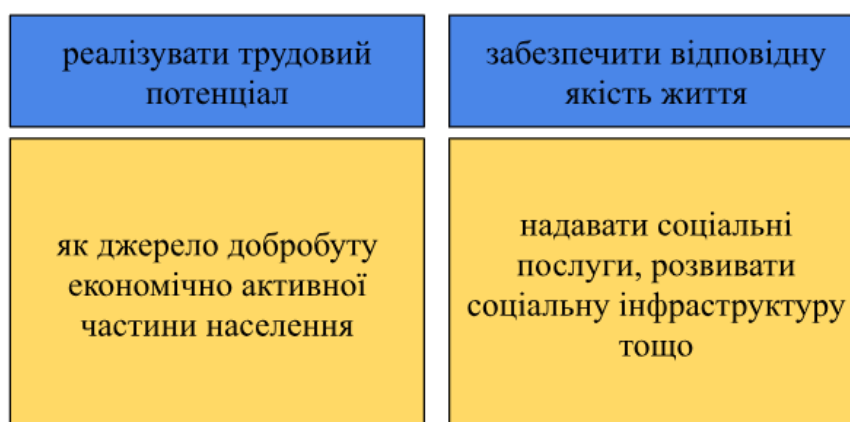
Рис. 1.1. Соціальна політика держави [Розроблена автором]

Соціальна політика держави в Україні має на меті реалізацію за двома основними напрямками, поданими нижче у вигляді схеми (Рис.1.1).