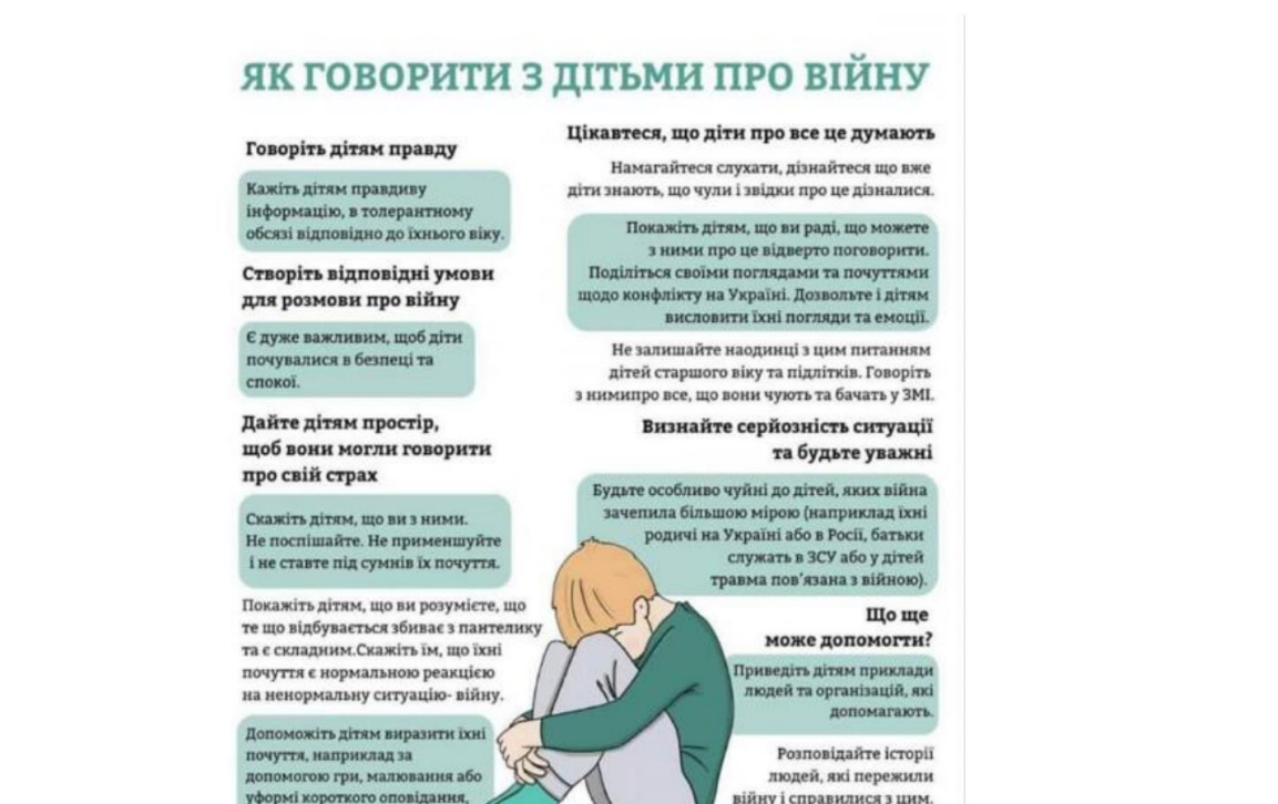
Рис. 2.5. Інформаційний постер «Як говорити з дітьми про війну» [15].

У розділі «Психологічна служба» розміщено інформацію щодо того як говорити з дітьми про війну, як відповідати дітям на складні запитання, як подолати паніку. Також представлено вправи і поради, як стабілізуватися під час війни, можна знайти гри та вправи на розвиток емоційної сфери; є коротка пам'ятка для педагогів, які працюють із дітьми під час війни, правила безпеки та можливості отримання допомоги в період конфлікту в Україні, матеріали для дієвої психологічної допомоги під час війни.