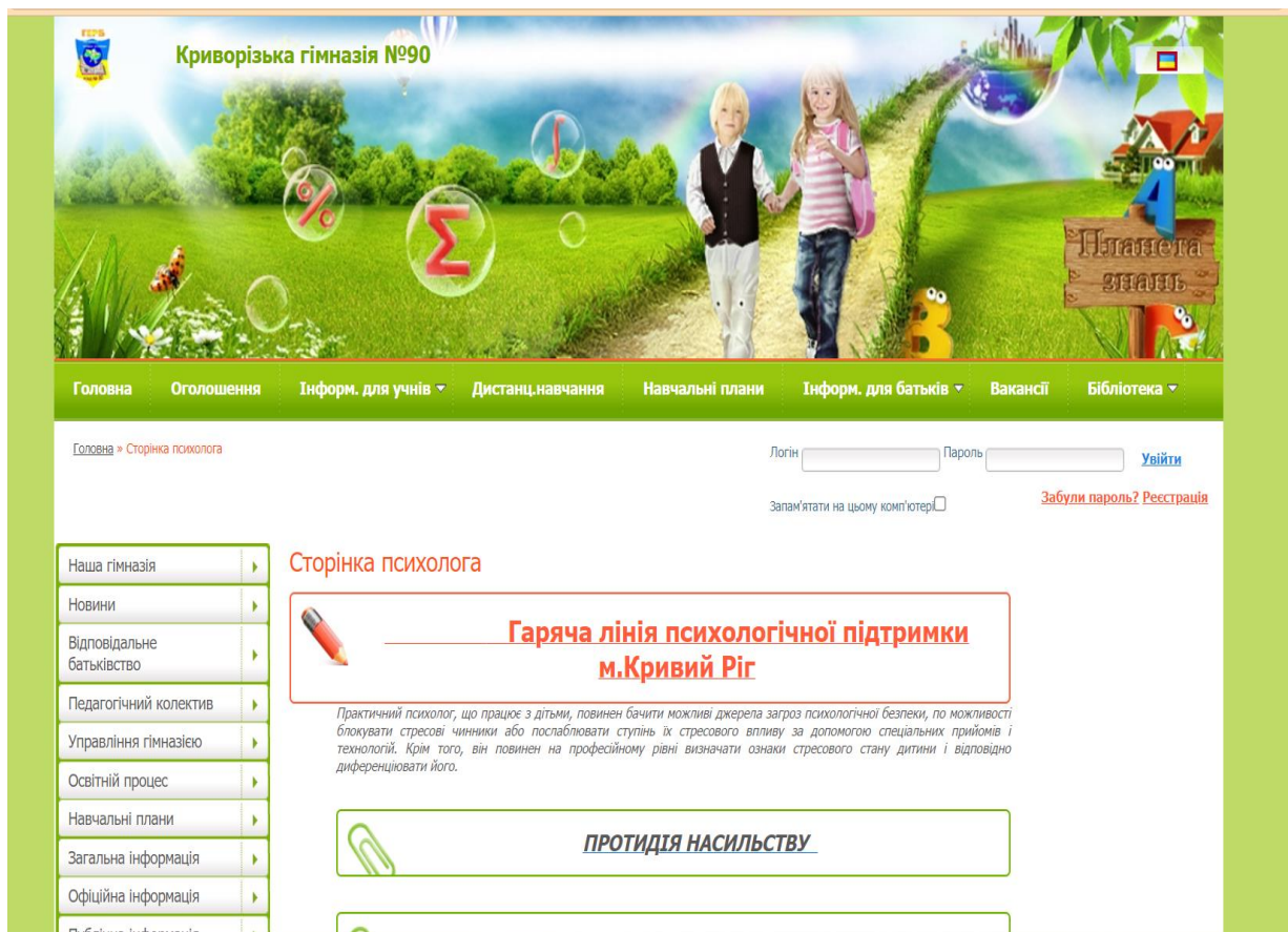
Рис. 2.3. Сайт Криворізької гімназії № 90

На сайті представлено роботу соціального педагога, зокрема висвітлено такі важливі питання як: інститут соціалізації особистості; права дітей та їхніх батьків; розкрито засади усвідомленого батьківства, надання першої неспеціалізованої допомоги дітям, які перебувають в посттравматичному стані тощо.