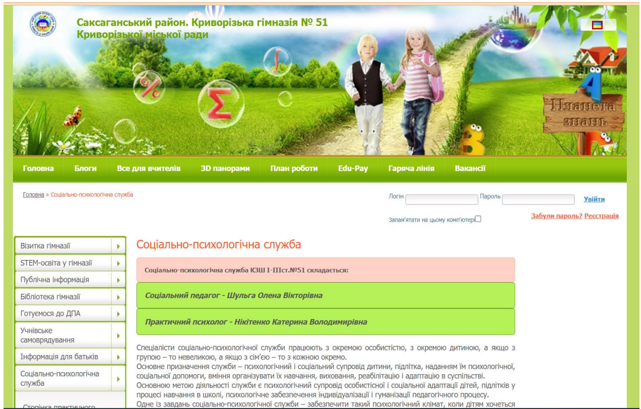
Рис. 2.2. Сайт Криворізької гімназії № 51

Разом з тим, можемо відмітити відсутність на сайті закладу освіти інформаційних матеріалів, пов'язаних із війною.