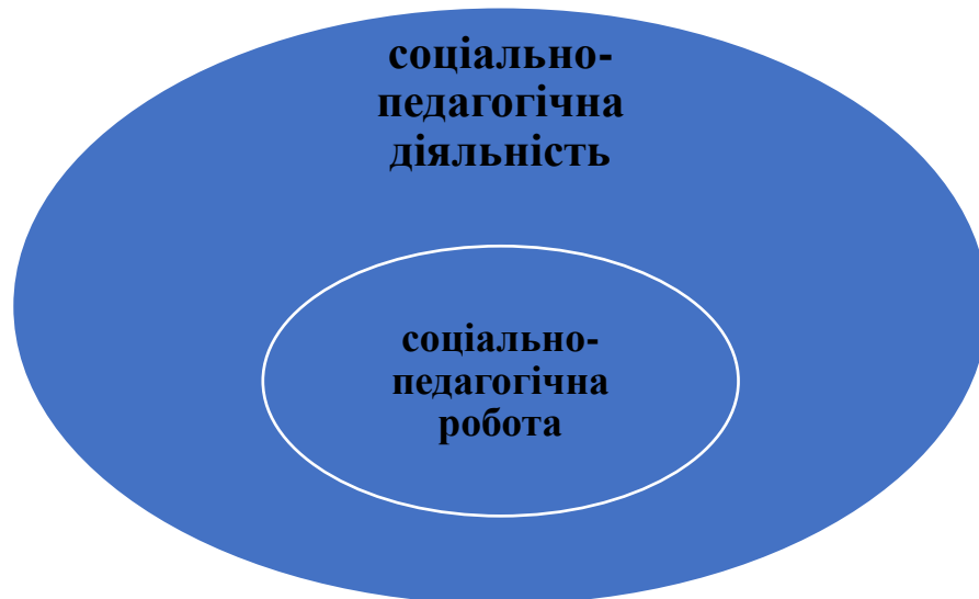
Рис. 1.1. Співвідношення соціально-педагогічної діяльності та соціально-педагогічної роботи

Відобразимо графічно взаємозв'язок соціально-педагогічної діяльності та соціально-педагогічної роботи на рис 1.1.