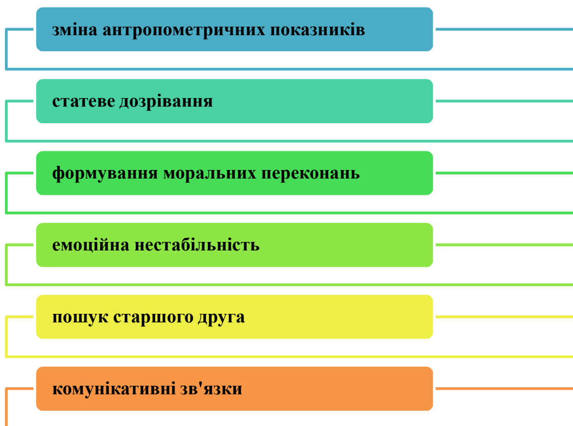
Рис. 1.2. Особливості здобувачів освіти підліткового віку

На рис. 1.2. представлено особливості здобувачів освіти підліткового віку.