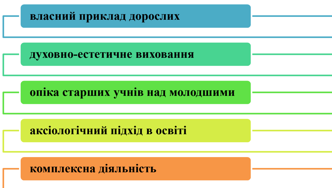
Рис. 3.1. Методичні рекомендації педагогам і батькам з формування ціннісних орієнтацій старшокласників

Узагальнено представимо методичні поради на рис 3.1. Детально опишемо кожен методичну пораду нижче.