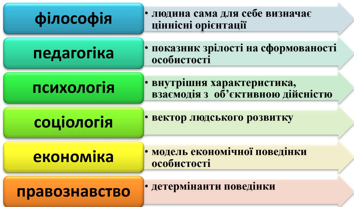
Рис. 1.1. Поняття «ціннісні орієнтації» в науковій площині

Таким чином, ми можемо унаочнити опрацьований матеріал щодо визначення поняття «ціннісні орієнтації» у наукових площинах.