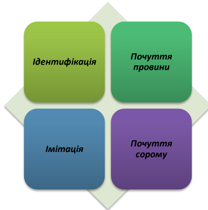
Схема 1.2. «Механізми соціалізації» за Фрейдом

Імітація в свою чергу – свідомі спроби дітей наслідувати певні моделі поведінки. Такими зразками для наслідування можуть бути батьки, родичі, друзі і т.д. Ідентифікація являє собою спосіб зрозуміти, що ти належиш до певної спільноти. Через цей механізм діти сприймають поведінку батьків, родичів, друзів і т.д., їхніх зразків поведінки, норми і цінності як свої власні[40].