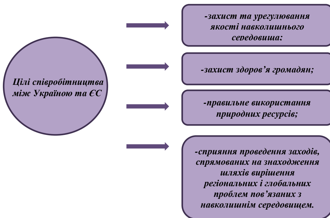
Схема 1. 1. «Цілі співробітництва між Україною та ЄС»

Складено на основі аналізу даних Міністерства захисту довкілля та природних ресурсів України[17].