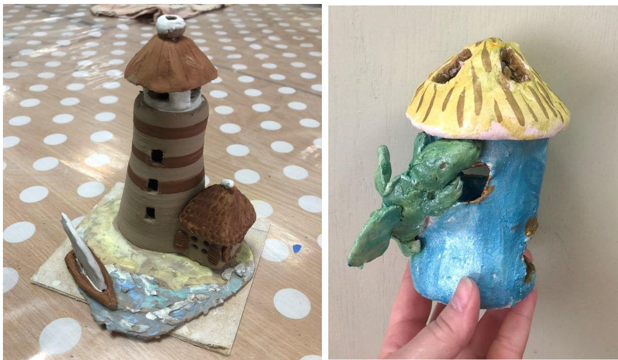
Рис.3. Скульптури учнів на уроці з арт-терапії «Картина світу» II етап