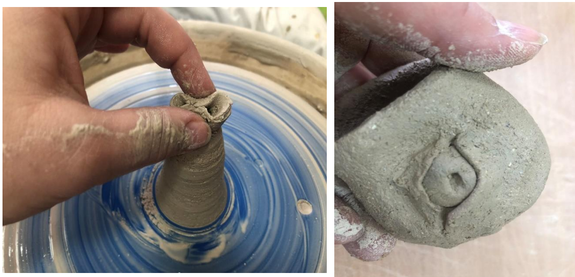
Рис.4. Формування частин тіла бичка