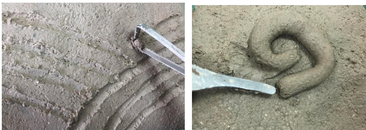
Рис.5. Нанесення декоративних елементів