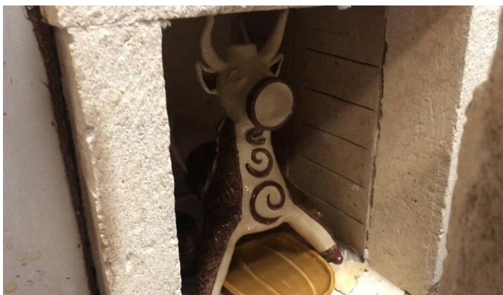
Рис.8. Випалення виробу в муфельній печі