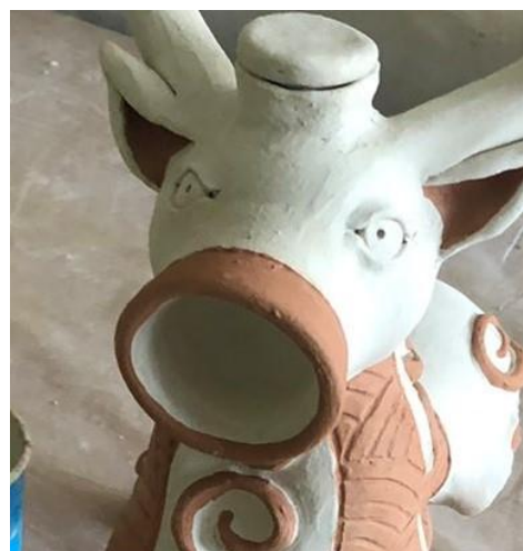
Рис.7. Нанесення підглазурної фарби (ангоб)