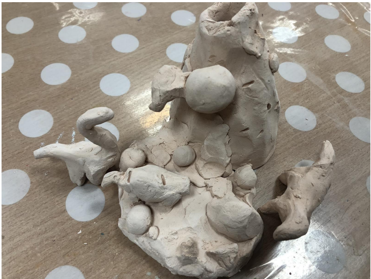
Рис.1. Роботи учнів «Картина світу»

Зверніть увагу на кольорову гаму малюнків, оскільки це також може бути інформативною частиною аналізу та інтерпретації основних елементів.