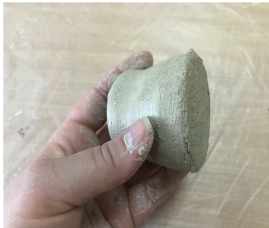
Рис.6. З'єднання частин тіла керамічного бичка між собою