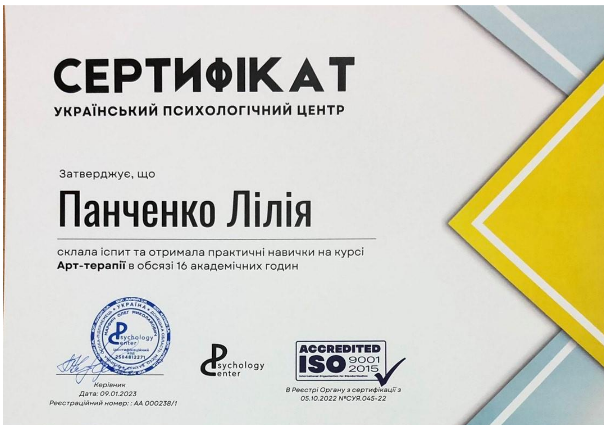
Рис.4. Сертифікат з загального курсу Арт-терапії