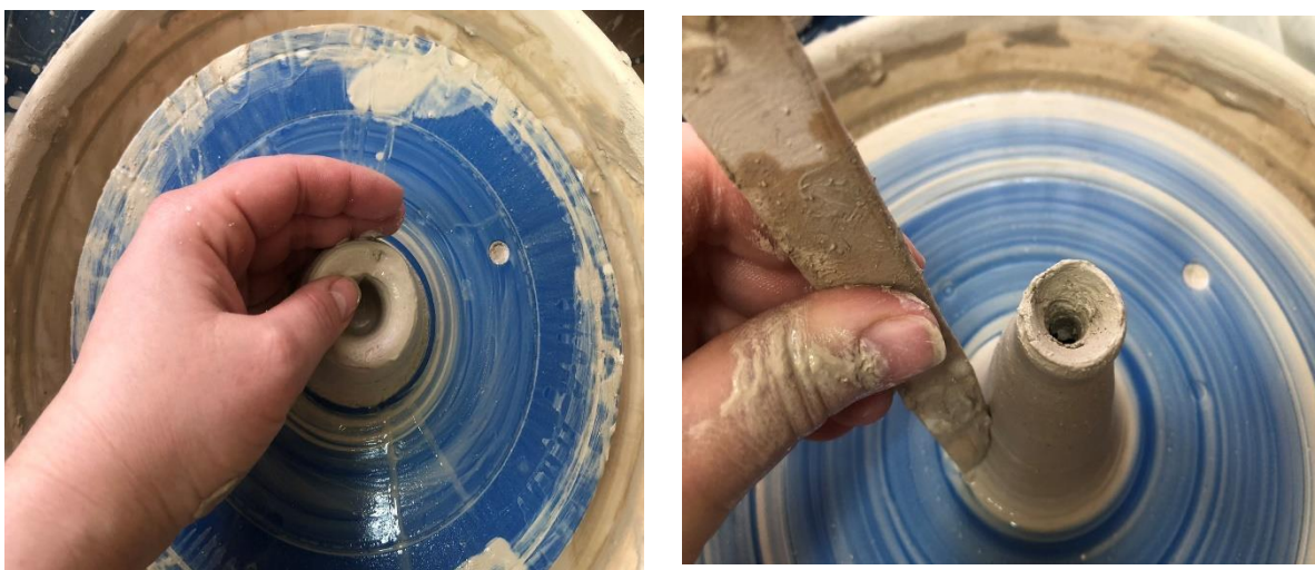
Рис.3. Процес виготовлення гончарних елементів