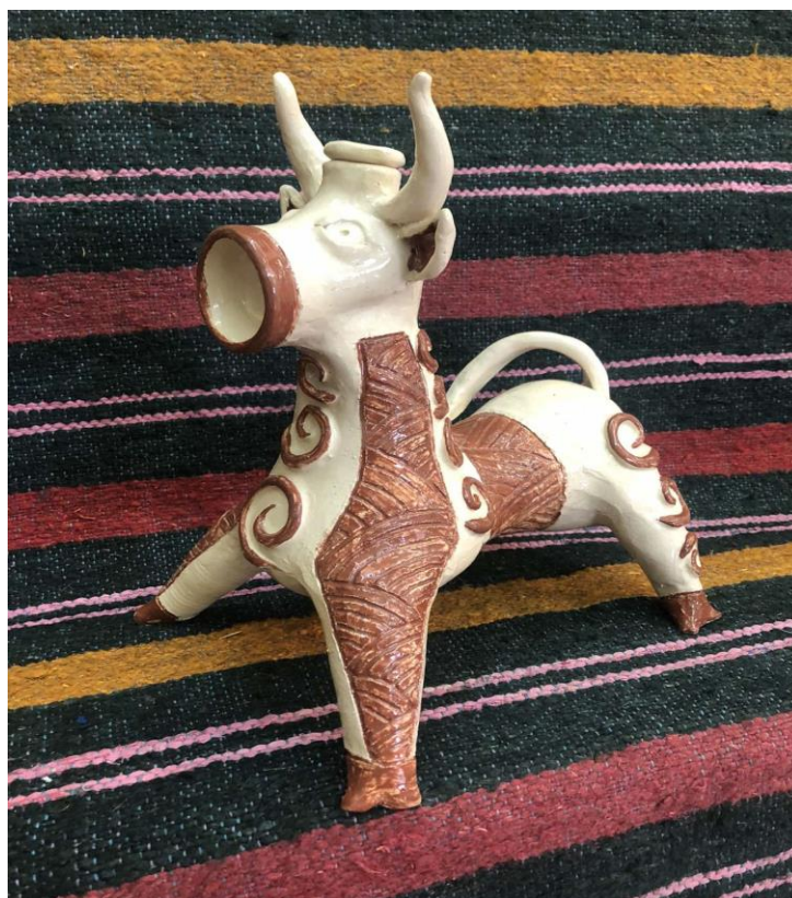
Рис.1. Покрокове виготовлення керамічного виробу «Бичок» до арт-терапевтичного заняття «Хто ти, тваринка?»