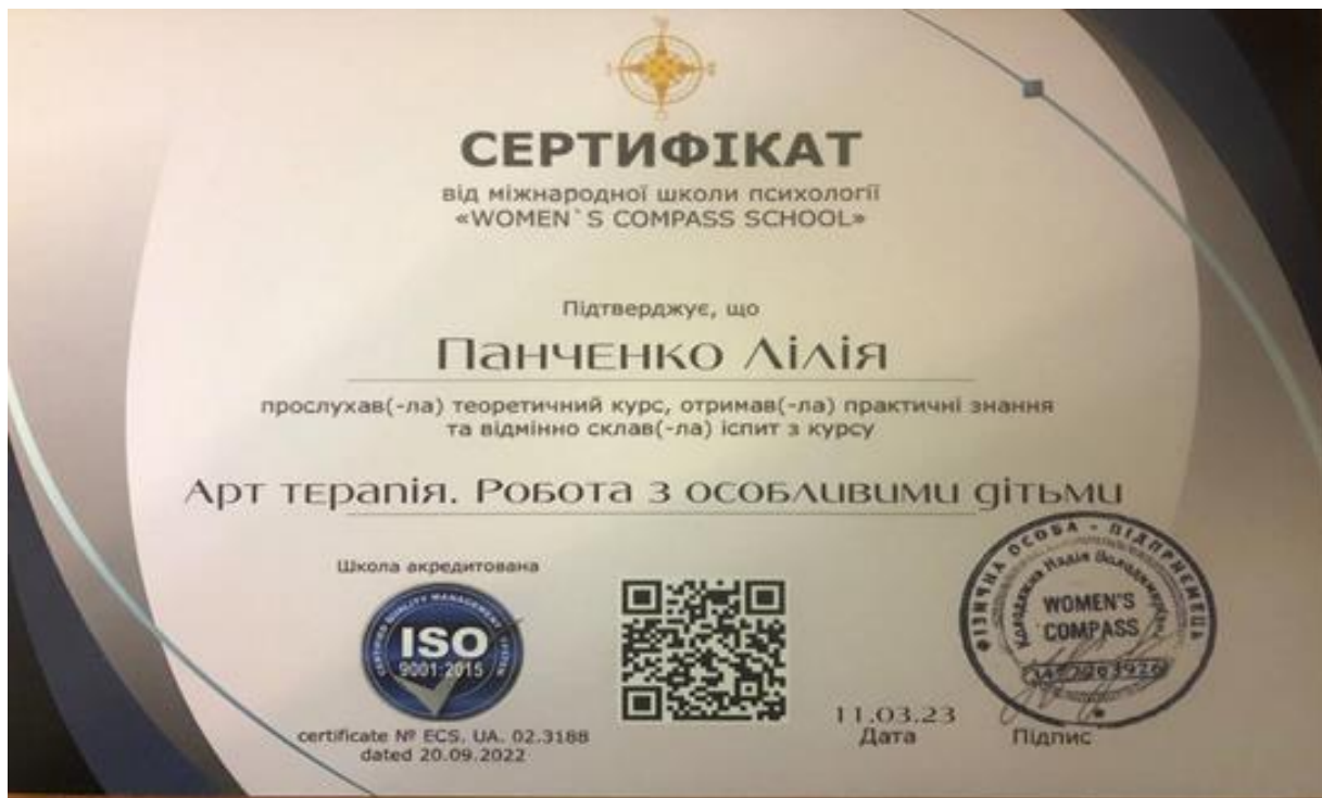
Рис.3. Сертифікат з курсу Арт-терапії. Робота з особливими дітьми