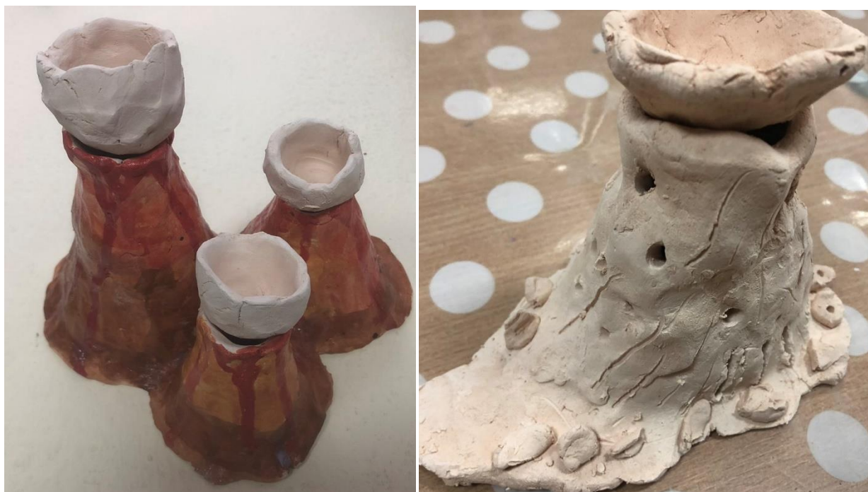
Рис.2. Скульптури учнів на уроці з арт-терапії «Картина світу» I етап