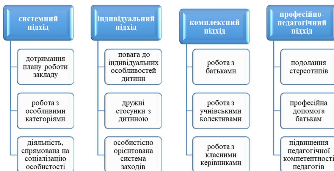
Рис. 2.1. Соціально-педагогічні умови успішної соціалізації школярів з неповних сімей.

Представимо соціально-педагогічні умови успішної соціалізації школярів з неповних сімей схематично на рис. 2.1.