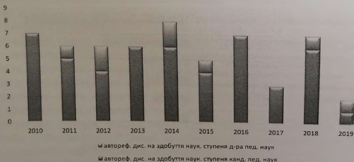
Рис. 1. Кількісний показник дисертацій за хронологією

Вищезазначеним критеріям відповідає 57 дисертаційних робіт, що розміщені на сайті Національної бібліотеки України імені В. І. Вернадського[4].