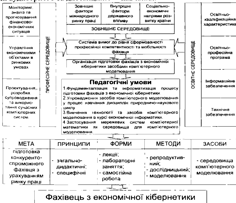
Рис. 1. Модель підготовки фахівців з економічної кібернетики засобами комп'ютерного моделювання

Для удосконалення професійної підготовки фахівців з економічної кібернетики засобами комп'ютерного моделювання розроблена модель (рис.1), що враховує вплив зовнішнього, професійного та освітнього середовищ [2]. В основу моделі покладені педагогічні умови. На основі цієї моделі розроблено систему реалізації педагогічних умов, що дозволяє на рівні цілей навчання – розширити мету навчання моделюванню структурних і динамічних властивостей економічних систем; на рівні змісту навчання – якісно перебудувати курс «Економічна інформатика» відповідно до напрямів майбутнього застосування систем комп'ютерної математики та упровадити спецкурс «Моделювання складних економічних систем»; на рівні методів навчання – впровадити елементи моделювання в різні методи навчання; на рівні засобів навчання – застосувати мережеві системи комп'ютерної математики; на рівні форм організації навчання – об'єднати форми аудиторного та дистанційного навчання.