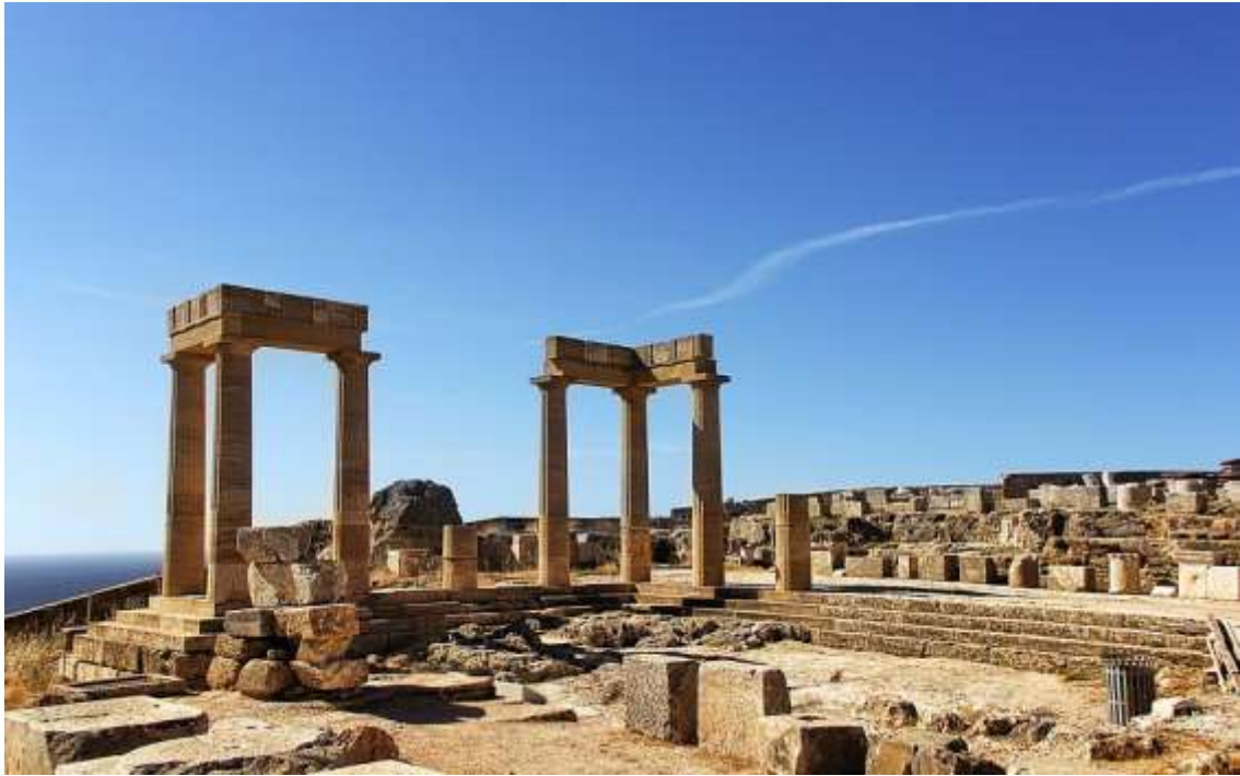
Рис. А.7. Олімпія, Греція