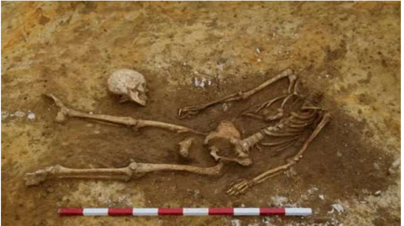
Рис. А.9. Кладовище безголових, Великобританія