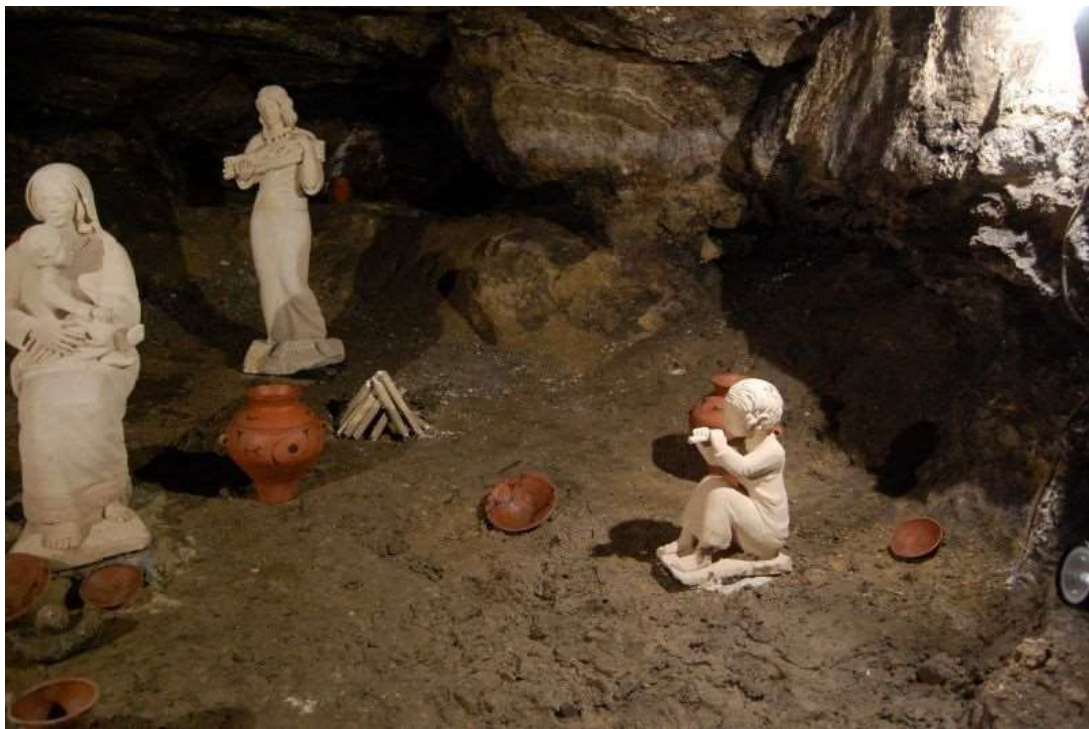
Рис. В.6 Печера-музей трипільської культури «Вертеба» с. Більче-Золоте