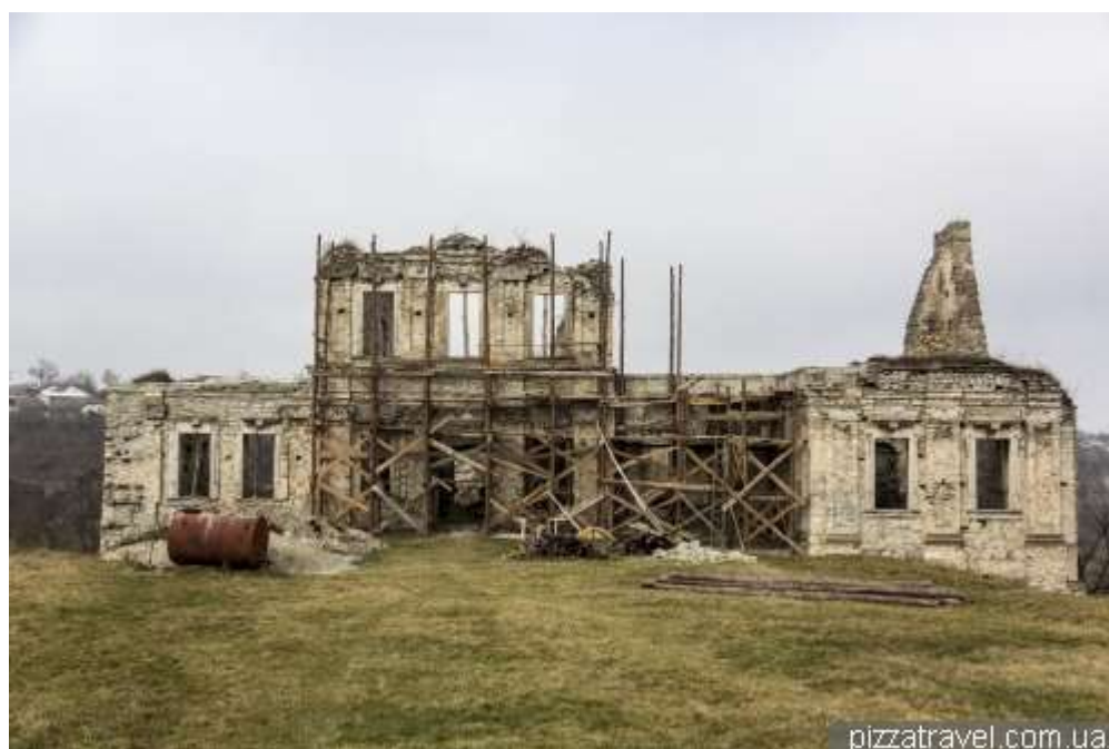
Рис. В.7. Скала - Подільський замок