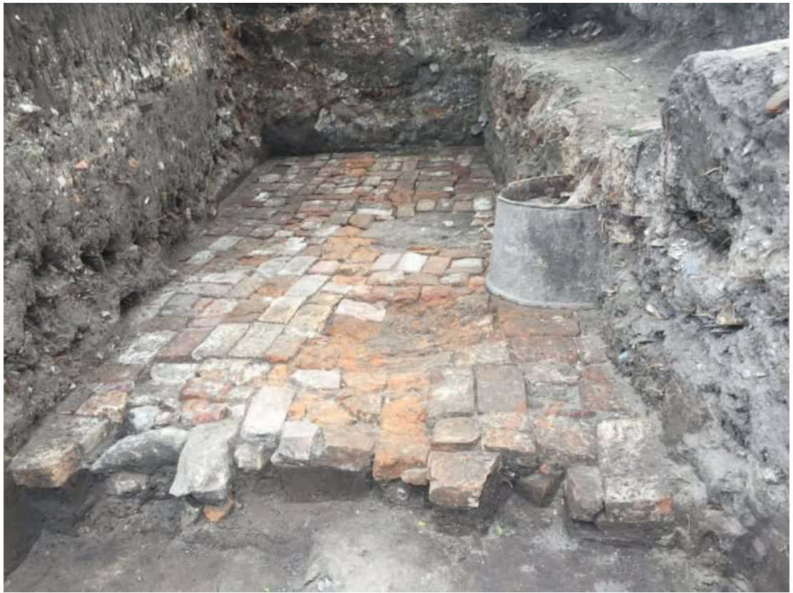
Рис. В.1. Розкопки оборонної стіни Тернопільського замку