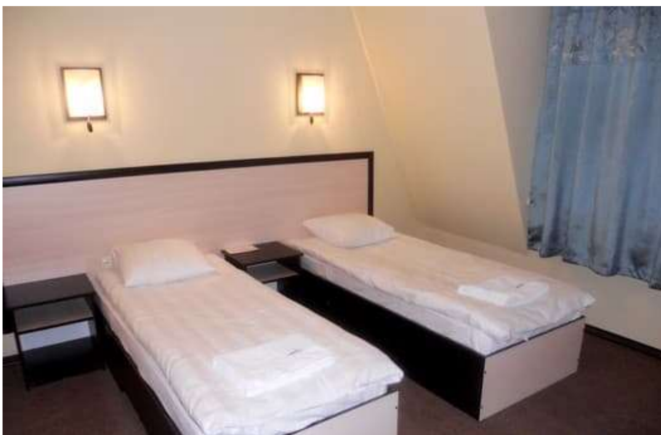
Рис. Г.2. Готель «Мандри»