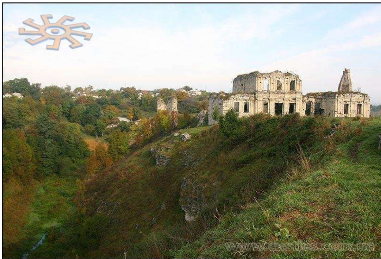
Рис. В.6. Скала - Подільський замок