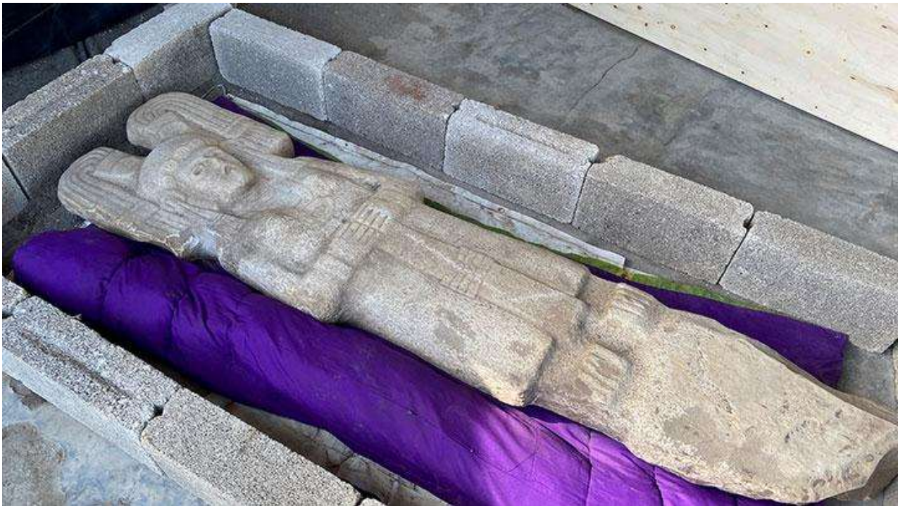
Рис. А.3. Статуя ацтекської цариці у Веракрусі