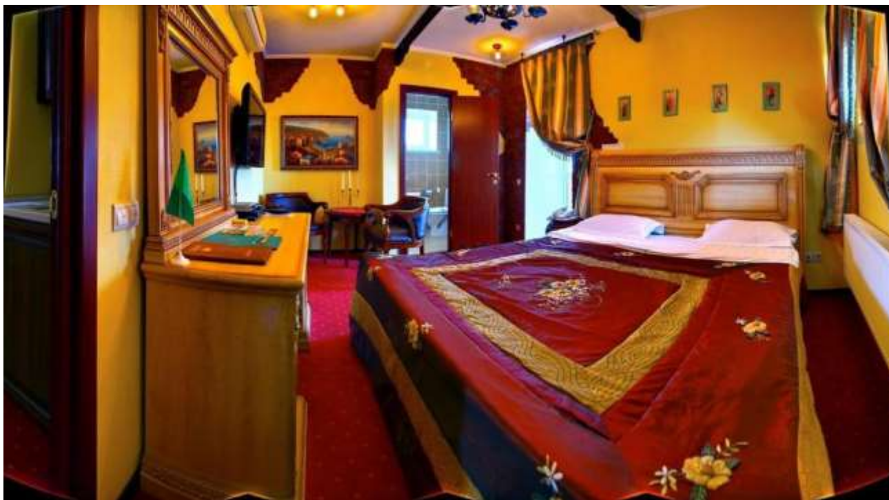
Рис. Г.4. «Меджибізький Замок»