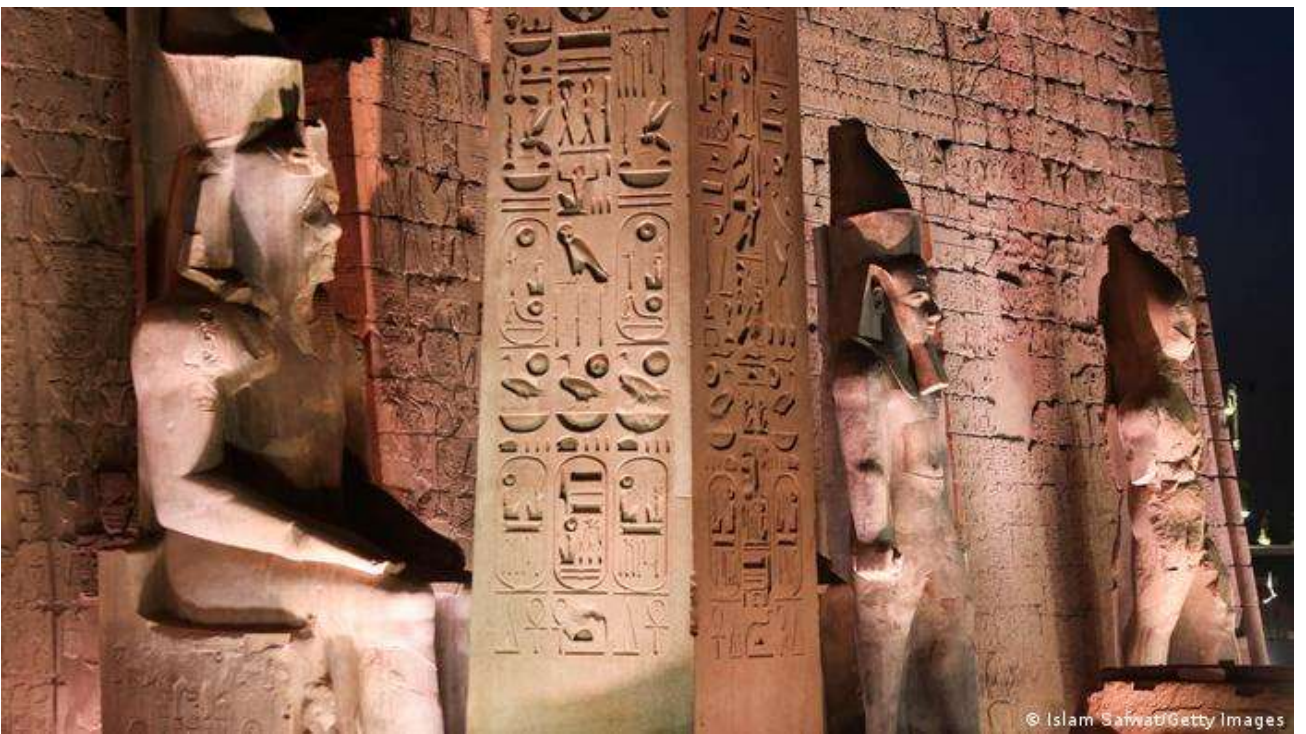
Рис. А.2. Алея сфінксів у Луксорі