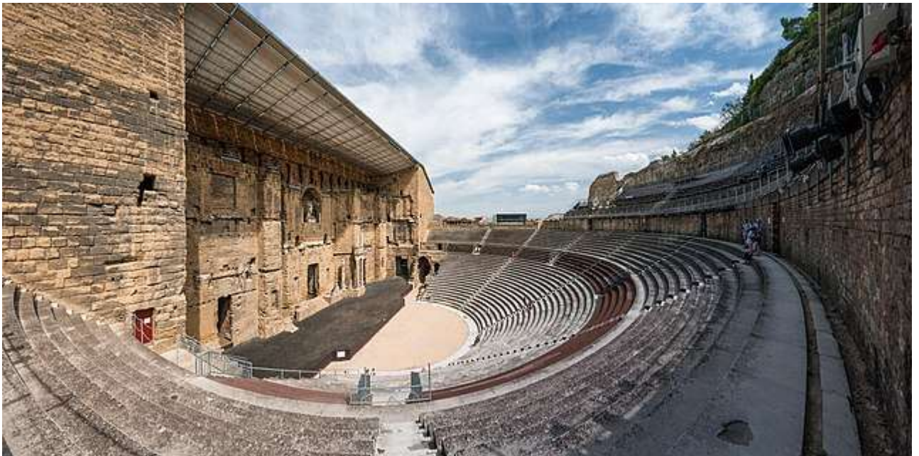
Рис. А.10. Давньоримський театр у Франції