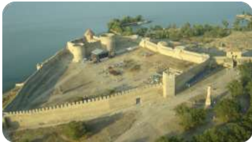
Рис. Б.6. Аккерманська фортеця