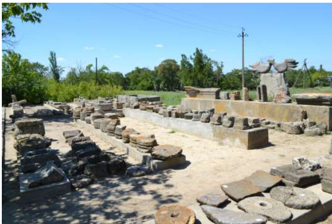
Рис. Б.2. Ольвія