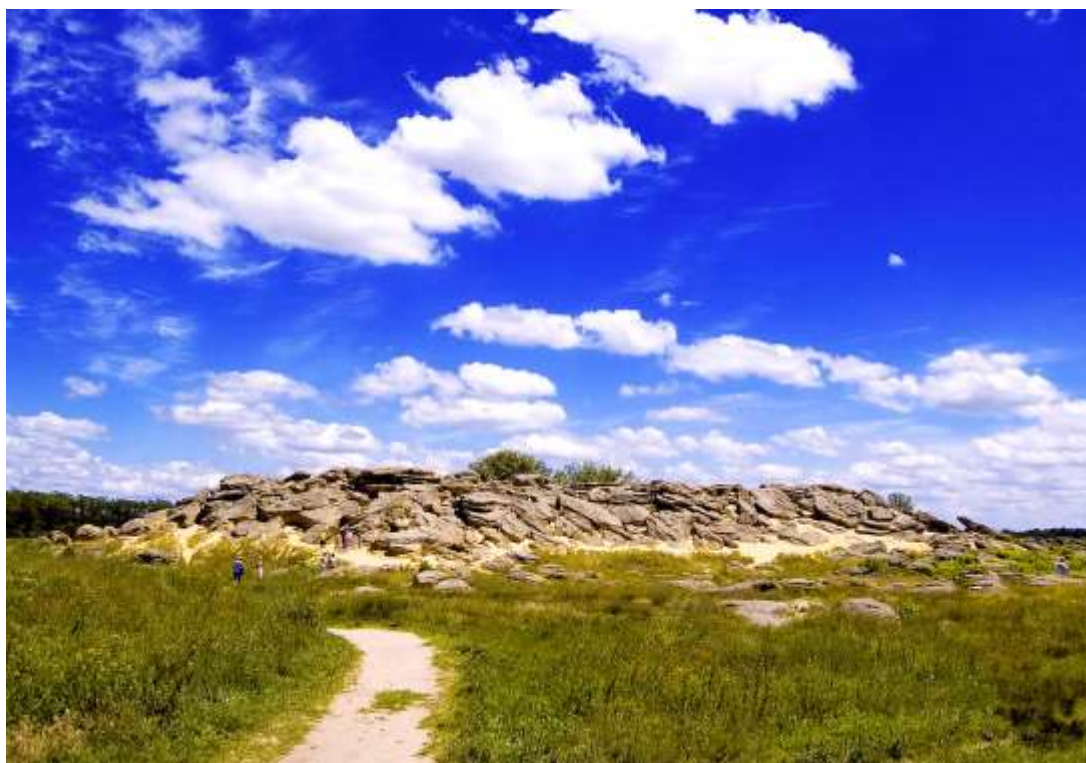
Рис. Б.4. Кам'яна могила