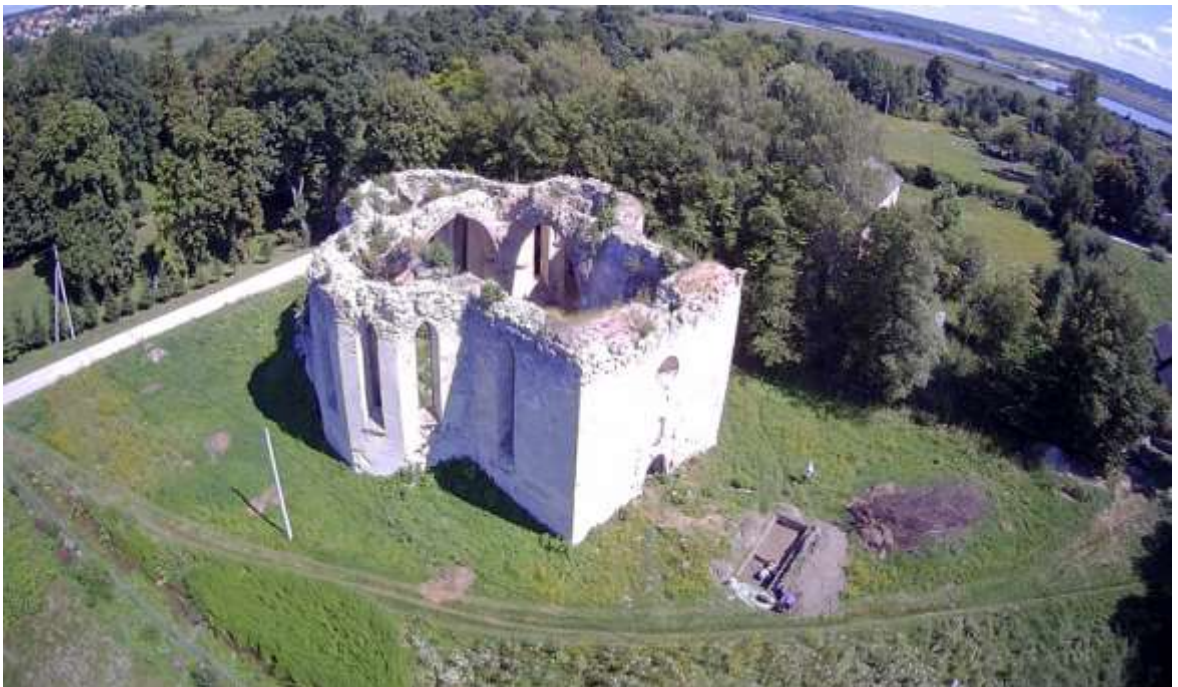
Рис. В.2. Костел св. Антонія XVI-XVII ст. (с. Залізці)