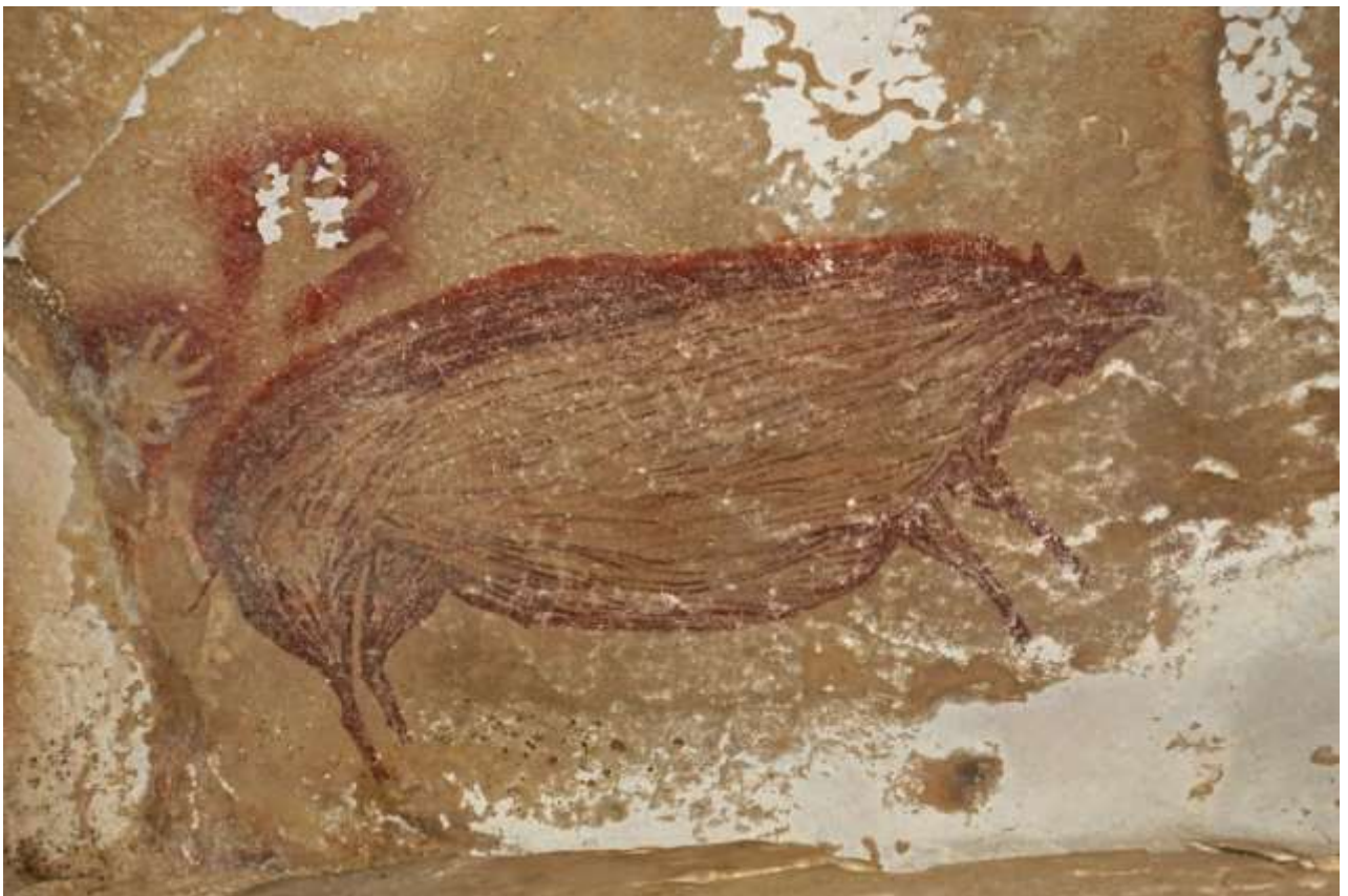
Рис. А.4. Малюнок дикої свині, о-в Сулавесі, Індонезія