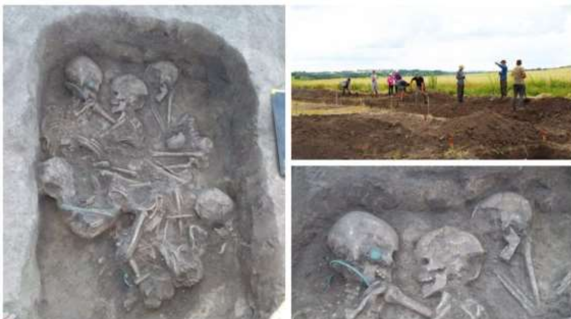
Рис. В.4. Археологічні розкопки в селі Кордишів