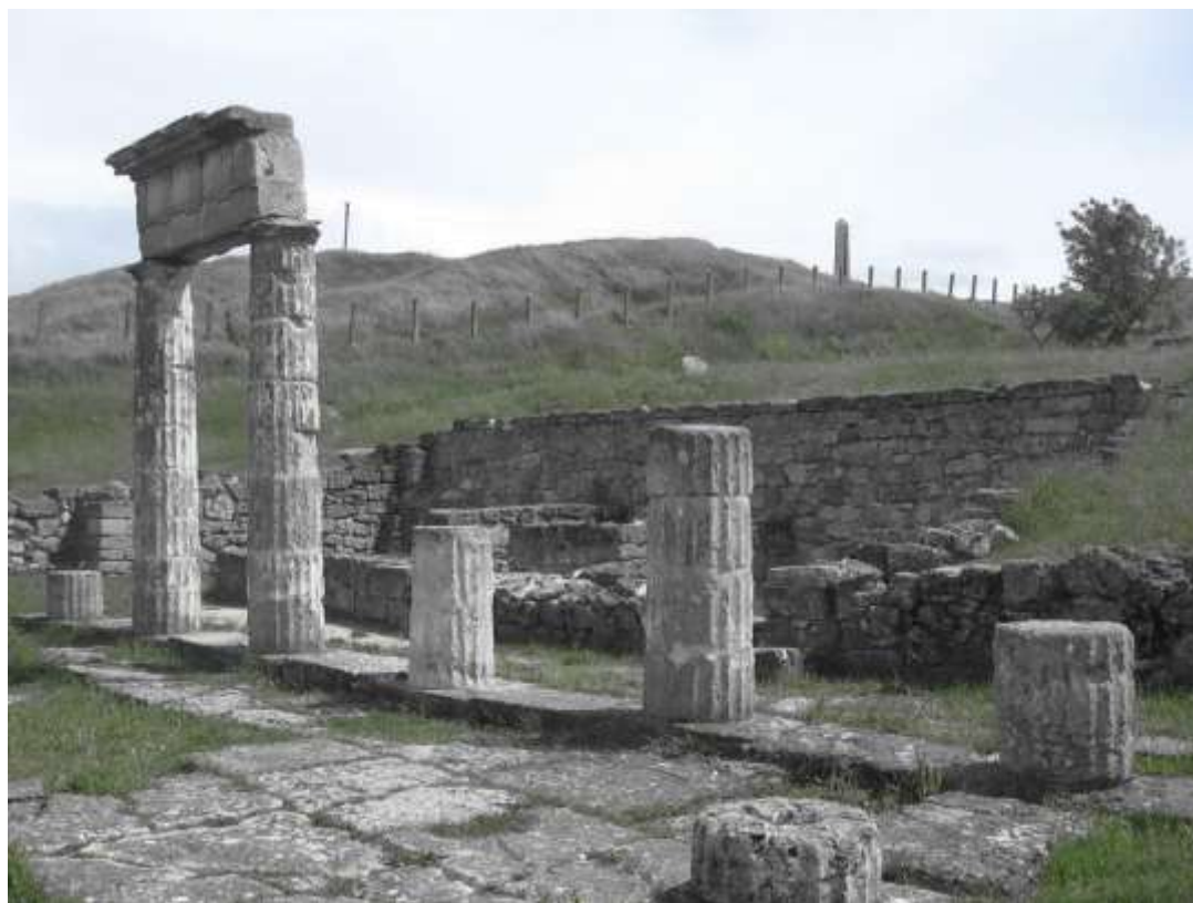
Рис. Б.3. Тіра