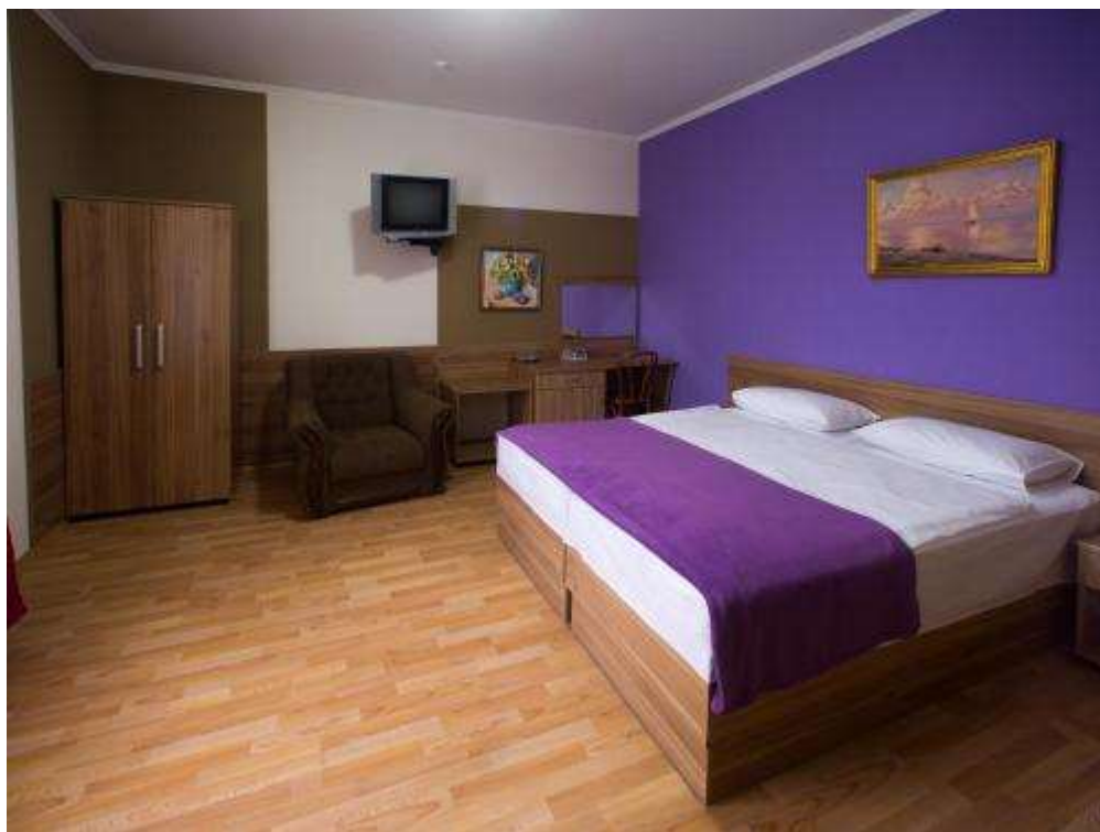
Рис. Г.3. «Гала Готель»