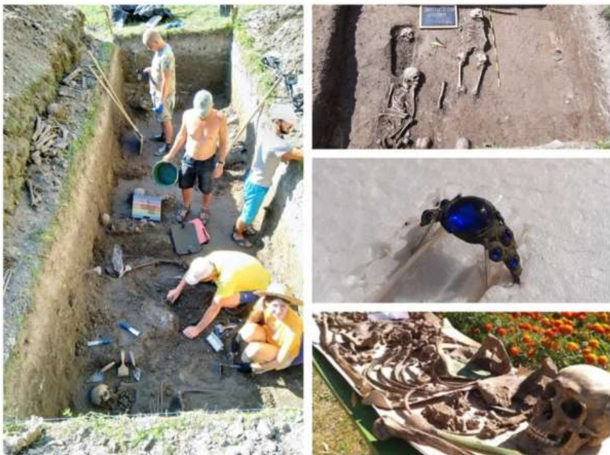
Рис. В.3. Розкопки біля Костел св. Антонія XVI-XVII ст. (с. Залізці)