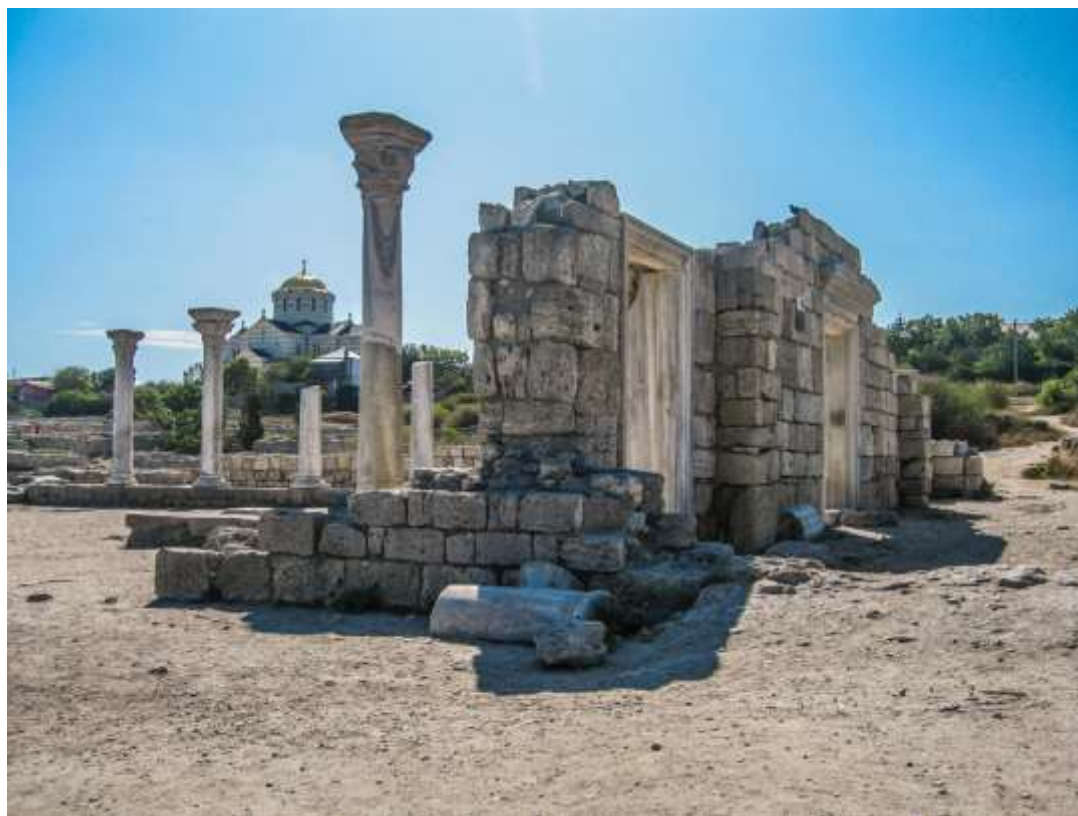
Рис. Б.1. Херсонес Таврійський