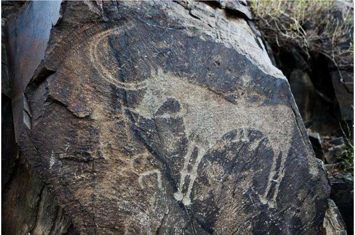
Рис. А.5. Петрогліфи археологічного ландшафту Тамгали, Казахстан