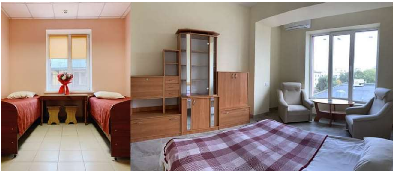
Рис. Г.1. Хостел «У Поттера»