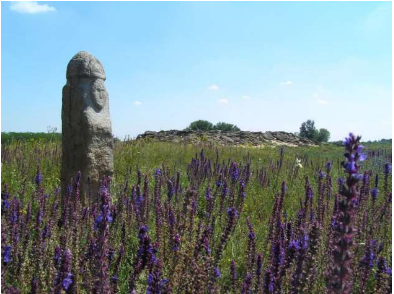
Рис. Б.5. Кам'яна могила