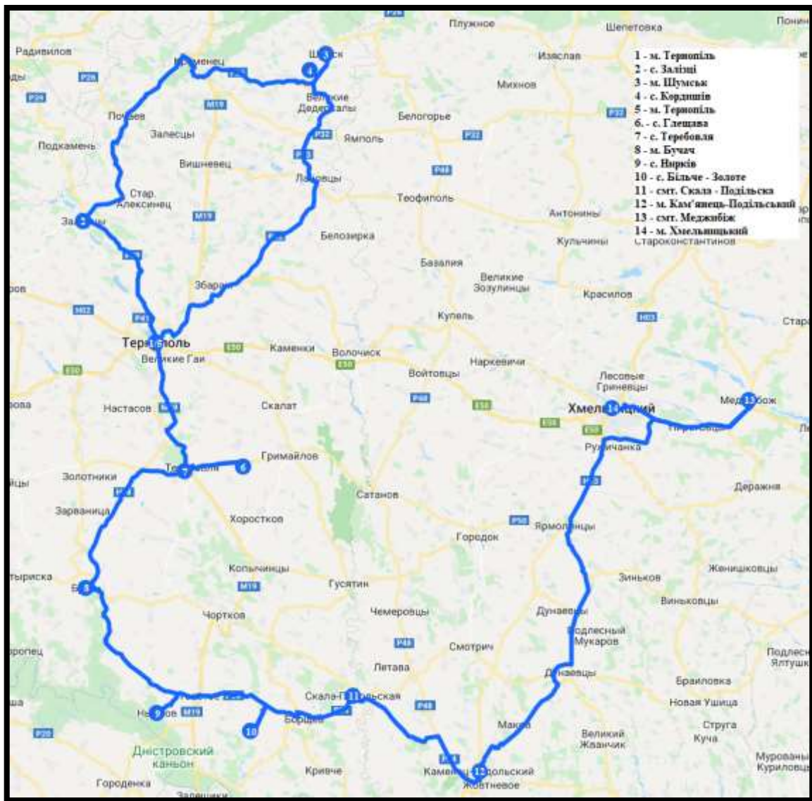
Рис. 2.2. Картосхема маршруту археологічного туру «Коштовності Тернопільщини: Від камінців до палаців!»

Після розробки схеми маршруту авторського археологічного туру «Коштовності Тернопільщини: Від камінців до палаців!» було здійснено його картографічне моделювання за допомогою сервіса Google-карти (рис. 2.2) з урахуванням оптимальних для руху туристичної групи варіантів проходження шляху автомобільним транспортом та економії часу.