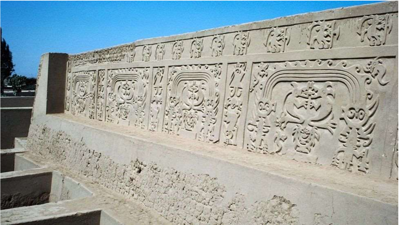
Рис. А.1. Таємнича могила у Перу