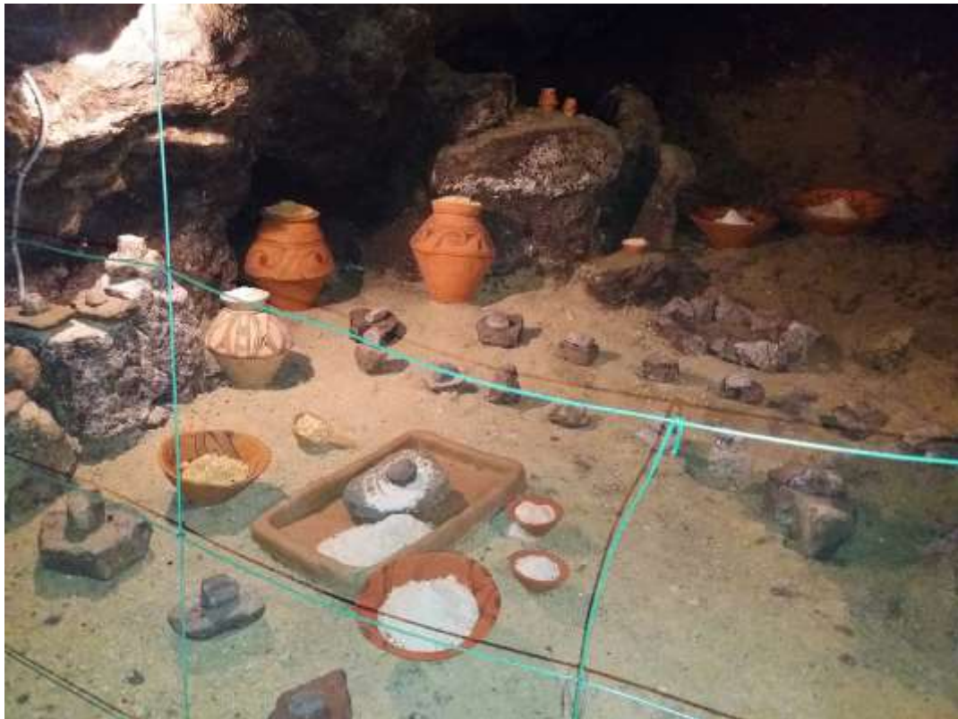
Рис. В.5. Печера-музей трипільської культури «Вертеба» с. Більче-Золоте