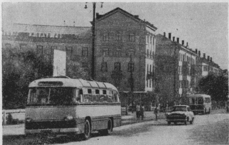
Місто гірників міняє своє обличчя. Одна з вулиць Жовтневого району сьогодні.

лових будинків зросла до 120872 кв. метрів. До 10-х років Жовтня в місті була збудована перша черга водопроводу. В 1926—1927 роках на березі р. Інгулець закладено великий парк ім. газети «Правда».