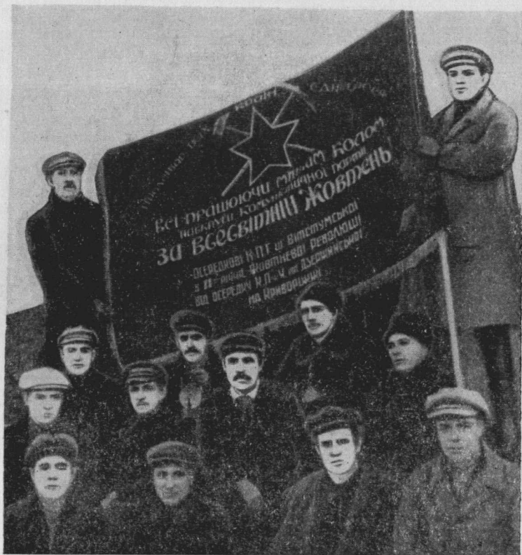
Червоний прапор гірників рудника ім. Дзержинського, подарований гірникам Мансфельда.

Посилилися інтернаціональні зв'язки трудящих Криворіжжя. Робітники активно відгукувались на події революційної боротьби в капіталістичних країнах. Коли застрайкували англійські гірники, то криворізькі гірники